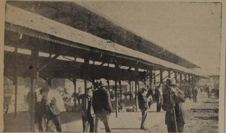
El galpón que se entregará a chacareros y donde ellos deberán expender sus productos sin intermediarios

tes, hemos adquirido a través de largos años, de pesada y tenaz labor y no se prosiga haciendo concesiones de locales o de sitios a personas que se imprevisan en este comercio. Debe respetarse el acuerdo municipal que no permite nuevas construcciones o ampliación de nuevos locales destinados al expendio de productos agrícolas.