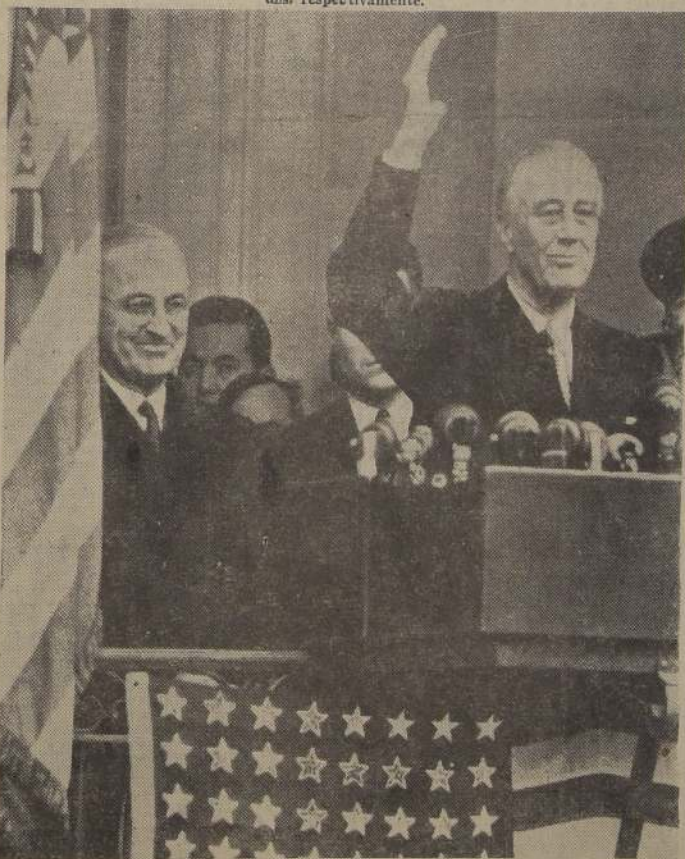
El Presidente Harry S. Truman junto al Presidente Roosevelt durante la ceremonia del juramento del recordado mandatario norteamericano. Truman se ha transformado en el continuador de la obra internacional de Mr. Roosevelt. "La experiencia ha demostrado que nuestro comercio con otras naciones aumenta a medida que la necesidad de ayudar a los pueblos a mejorar sus condiciones económicas."

INDEPENDENCE (Missouri), 20. — (U. P.). — Un incendio destruyó cuatro edificios por valor de dos millones de dólares, en el centro comercial de esta ciudad, donde nació el Presidente Truman. El día de hoy había sido proclamado por el Alcalde como "Día de la Inauguración". Muchos de los más destacados ciudadanos de la ciudad se encontraban en Washington cuando se inició el fuego, en el subterráneo de una mercería.