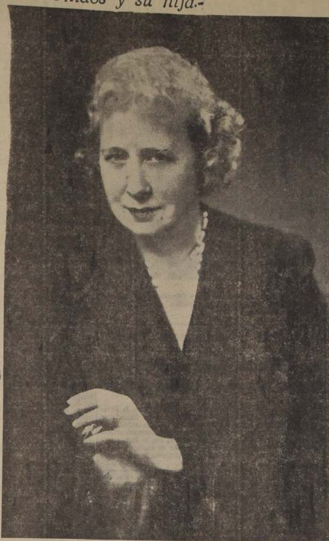
Mrs. BESS WALLACE DE TRUMAN, esposa del Presidente de los Estados Unidos.