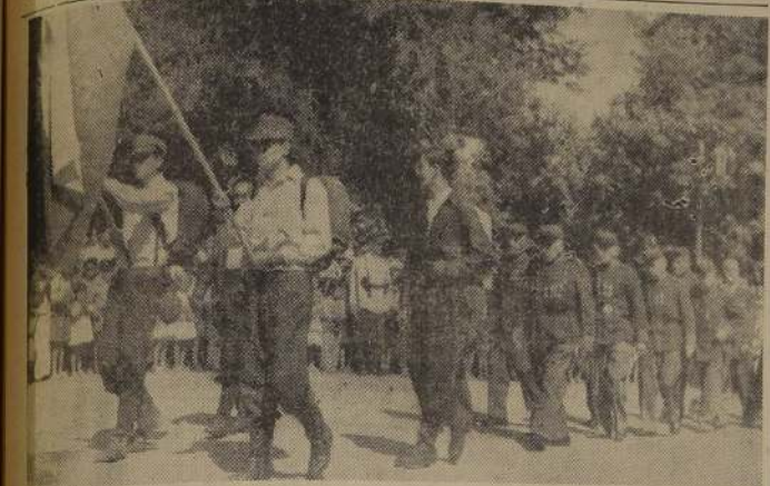
Los hoy scouts portando el Pabellón Nacional, y los Veteranos del 79, inician el desfile que se efectuó en la Plaza Yungay, durante los actos en celebración de la Fiesta del Roto Chileno.