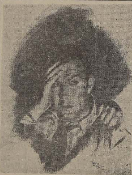
Los manos refrenan en Robert Taylor el deseo de asesinar en "MURO DE TINIEBLAS", el nuevo y emocionante drama de la Metro Goldwyn Mayer, en el que el astro desempeña su más vigoroso rol como un maniaco sospechado de homicidio. ¿A quién pertenecen estas manos? Tal vez sean las de Audrey Totter, Herbert Marshall y Dorothy Patrick. Usted encontrará la respuesta en la pantalla del teatro Metro.