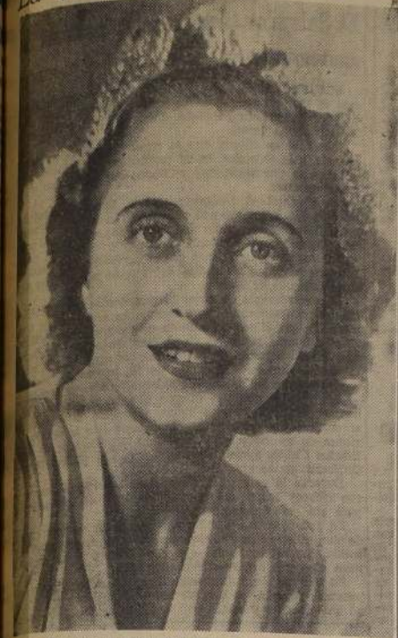
Miss MARGARET TRUMAN, hija del Presidente de los Estados Unidos.