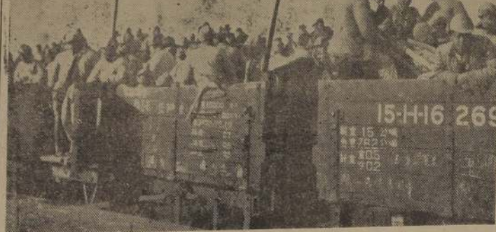
FUKOW (China).— Tropas nacionalistas chinas se retiran en carros ferroviarios del frente de Fengpu. Están cerca de Fukow, justamente al otro lado del río Yangtze, en línea recta de Nanking.

Reno se ha visto afectado por una serie de temblores, hasta en la proporción de 50 por día.