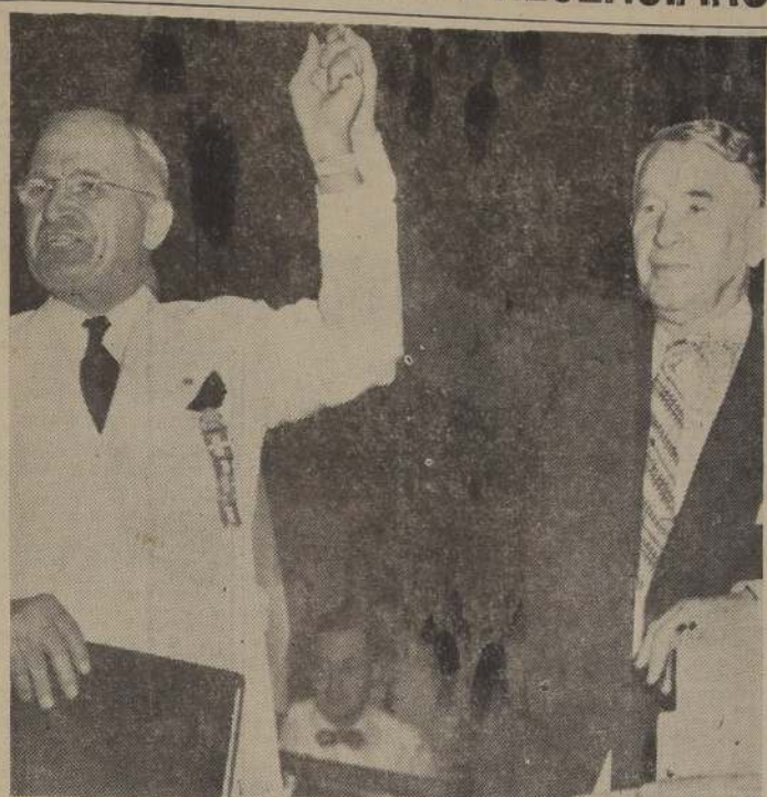
Esta fotografía de Mr. Truman y Alben W. Barkley, captada durante la proclamación de sus candidaturas por la Convención Demócrata de julio del año pasado, cobra actualidad al haber asumido, ayer, ambos estadistas la Presidencia y Vicepresidencia de Estados Unidos, respectivamente.

Mr. Harry Truman es desde ayer el 33.º Presidente de EE. UU.