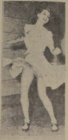
Alli Khan es la heroína de la comedia "Bailando nace el amor". La atractiva Rita Hayworth, que actualmente hace noticia con motivo de su próximo matrimonio con Aga Khan, es la heroína de la comedia "Bailando nace el amor".

Una noticia que ha producido justificado interés en todos los círculos es la de la próxima venida para actuar en nuestro país, de la famosa orquesta de Xavier Cugat. Pues bien, nuestros lectores podrán tener un anticipo de las actuaciones de este notable conjunto, al presenciar las exhibiciones de la extraordinaria producción del sello Columbia "Bailando nace el amor", que inicia sus presentaciones desde hoy día en la Sala Cervantes. En "Bailando nace el amor" tienen a su cargo la responsabilidad de los roles protagónicos la sugerente y atractiva Rita Hayworth, la estrella que actualmente está haciendo más noticia que nunca con su matrimonio con el hijo del Aga Khan, después de haber estado casada con el famoso director y actor Orson Welles, y que en la cinta en referencia actúa junto al formidable bailarín Fred Astaire, con quien forma una pareja estupenda. Entre la música bellísima que se puede escuchar en "Bailando nace el amor" figura la difundida composición de nuestro compatriota Nicanor Molinare, "Chiu-Chiu".