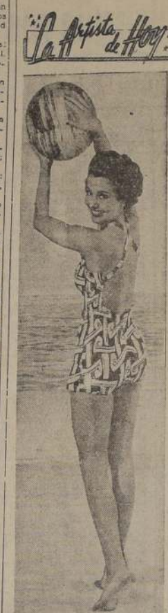
CYD CHARISSE. Comenzó su carrera como bailarina con el Ballet Russe de Montecarlo. Su arte y belleza no tardó en atraer la atención de los estudios cinematográficos, habiendo sido contratada por los Estudios Metro-Goldwyn-Mayer, en donde desempeña papeles de importancia, como en "Fiesta Brava", al lado de Esther Williams y Ricardo Montalván.

OTRO FILM DE SANDRINI SERA ESTRENADO PRONTO. La sensacional película de Luis Sandrini "Loco Lindo", que fuera para él la iniciación de su carrera como el más grande astro cómico del cine argentino, será estrenada en breve por el Sello Garantizado Pictures, que ha traído al país una copia flamante de esta película.