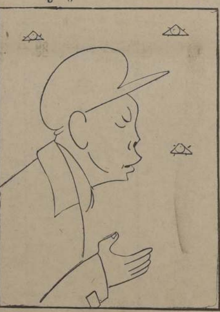
El misterioso Mao Tse-Tung, líder de los ejércitos comunistas chinos, y figura clave en la futura situación política de ese país