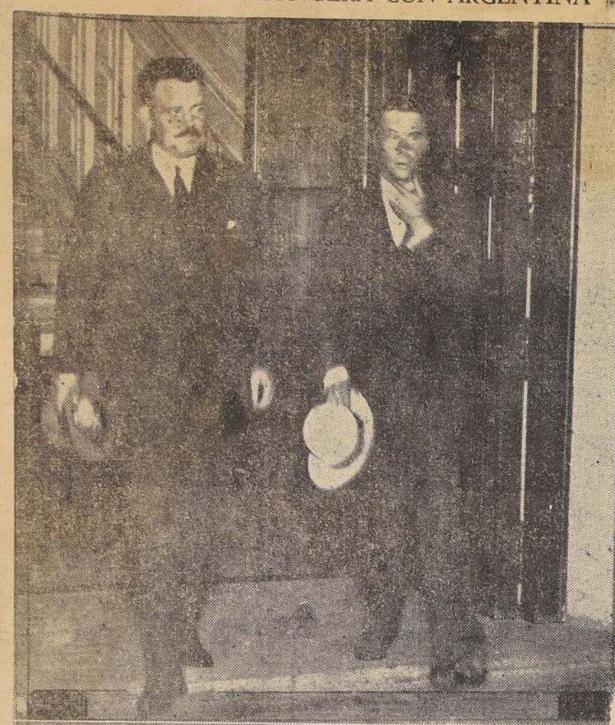
S. E. el Presidente de la República y el Príncipe de Gales salen del Palacio de Gobierno para dirigirse a la Estación Alameda.

EL TREN ESPECIAL PARTIO A OSORNO A LAS 21.37 HORAS. — SOLO EL MINISTRO DE MARINA Y EL INTRODUCTOR DE DIPLOMATICOS ACOMPAÑAN A LOS PRÍNCIPES HASTA LA FRONTERA CON ARGENTINA