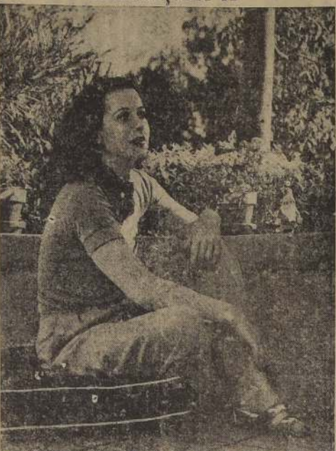
Hedy Lamarr que, junto con Clark Gable, protagoniza la gran producción que mañana estrena el Metro

Mañana, en sus funciones de matinee vermouth y noche, el Teatro Metro presentará uno de los más grandes estrenos de la presente temporada: "El Camarada X", con Clark Gable y Hedy Lamarr.