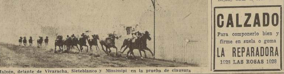
Malvén, delante de Vivaracha, Sietebanco y Mississippi en la prueba de clausura.