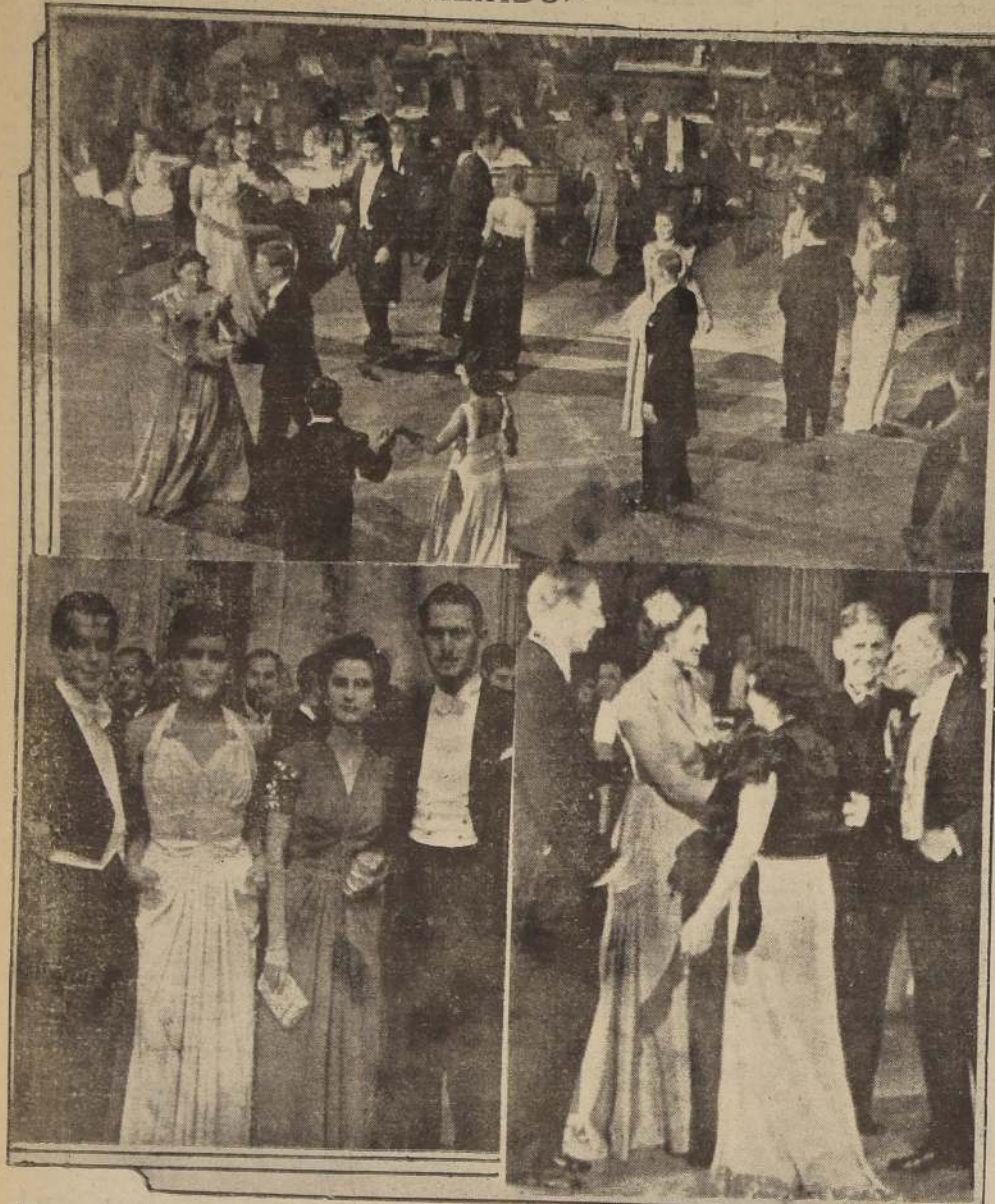
Algunos aspectos durante el gran baile que como homenaje a Chile organizaron las Colonias Aliadas, a beneficio de la Protectora de la Infancia, y que se realizó antenoche en el Teatro Municipal. Esta fiesta, que alcanzó extraordinario brillo, se vió concurrida por cuanto más selecto de las Colonias Aliadas, de la sociedad de Santiago y miembros de la Diplomacia; prolongándose hasta avanzadas horas de la madrugada en medio de general animación.