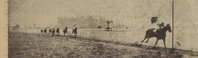
Malayo gana al galope los 1.400 metros del clásico "Presidente de la República". Lo escoltan muy de lejos Andalousie, Macanudo y Nicanor.

900. San Pancho pasó resueltamente a marcar rumbos, seguido por Norodine, Kolynos y los restantes en la forma indicada precedentemente, y sin otra variante que el avance de Albalaca por el lado exterior en plena curva, llegó el lote a la recta final. En los comienzos de ella, Norodine dejó atrás a San Pancho, pero al volver a recurrir a sus mejores energías para mantener el violento avance final de Cedrova que subió a sólo un pescuezo de él. Tercero, a dos cuerpos remató San Pancho delante de Norodine. Último Monsiegnur. MALVEN EN LA CLAUDIA Malvén se impuso estrechamente en la prueba de clausura, derrotando a Vivaracha que cayó con todos los honores. La partida se dio en buen momento y a los cien metros