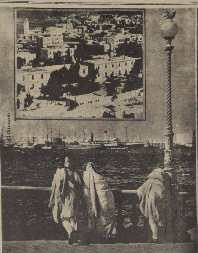
Vistas del puerto y la ciudad de Trípoli, capital de la colonia italiana de Libia o Trípoli-tania. Esta región, situada en la ribera sur del Mediterráneo, continuará siendo administrada por Italia bajo la supervisión de un fideicomiso de las Naciones Unidas.