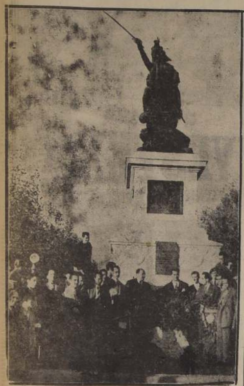
El líder peruano, señor Víctor Raúl Haya de la Torre, acompañado de los atletas de su país que participan en el Campeonato Sudamericano, al pie del monumento a Bernardo O'Higgins, donde depositaron ayer una hermosa ofrenda floral.

MAYA DE LA TORRE Y ATLETAS PERUANOS RINDIERON AYER UN HOMENAJE A BDO. O'HIGGINS