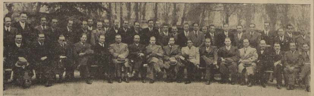
Asistentes al almuerzo de ayer en el Estadio Francés