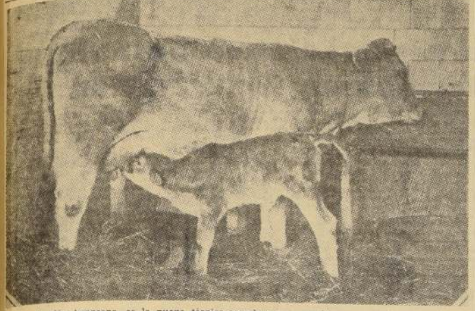
La reproducción temprana, es la nueva técnica ganadera que permite que vaquillas bien desarrolladas tengan sus crías entre los 24 y 30 meses de edad.