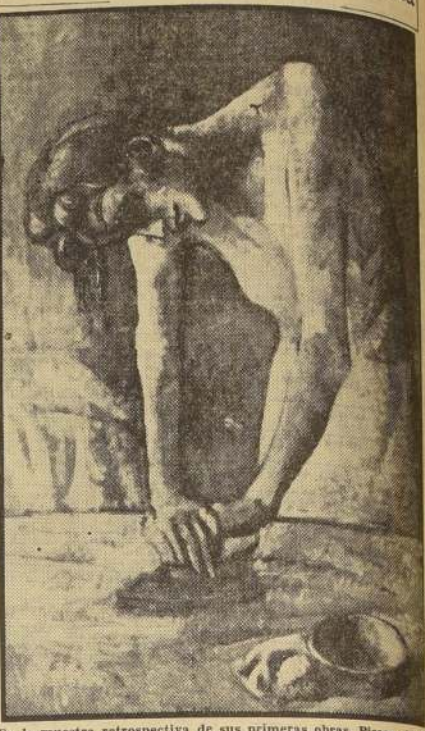
En la muestra retrospectiva de sus primeras obras, Picasso donó la Tercera Bienal de Arte Hispano-Americano, de Barcelona, aquí “La Planchadora”, una de las obras más aplaudidas del gran artista.

PARIS.— Pierre Mendes-France es un hombre exento de poses. Prefiere la familiaridad al protocolo. Y así es con los periodistas, después de su reciente elección como vicepresidente ejecutivo del Partido Radical Socialista. (Para la presidencia, es más bien un cargo honorífico, fue reelegido el viejo líder Edouard Herriot.) Dentro y fuera del partido, Mendes-France fustiga la política de su correligionario y amigo, el Premier Faure, que se ha propuesto disolver el Parlamento y llamar a nuevas elecciones, para darle a Francia un Gobierno estable y definitivo. Al efecto, el Premier propicia, también, una reforma electoral, de fondo de la política francesa. Mendes-France es partidario de una reagrupación de los partidos de izquierda, con los partidos católicos, que fueron sus colaboradores cuando empujaron las riendas del poder. Faure es partidario de que su partido no se amarras de nuevo, para tener libertad de acción entre la izquierda y la derecha.