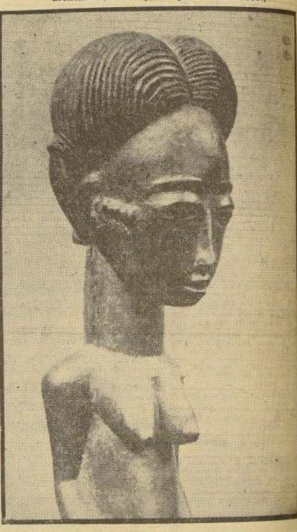
En los salones de la Tercera Bienal de Barcelona, dedicados al primitivo, se destaca esta estatua de madera, descubierta en Costa de Marfil del continente africano. Representa a Kaka, Genio de la Selva.

Es la nueva tendencia de la arquitectura ESTUDIOS