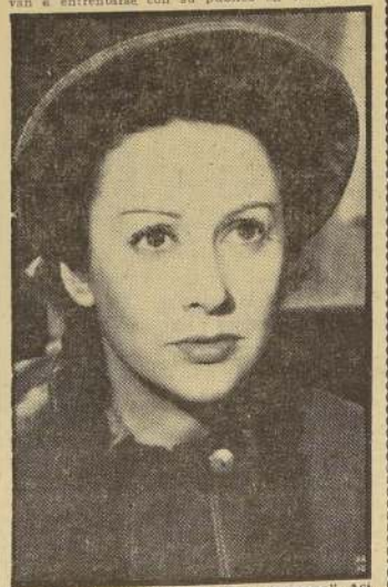
La rubia Martine Carol es ahora “morena”, así, e inclusive más delgada, aparecerá en “Lola Montes”.

OTRAS EXPERIENCIAS. — Y de esa experiencia podrán servirse igualmente los galanes jóvenes que van a enfrentarse con su público en condiciones