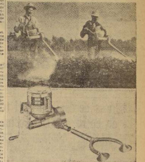
La descarga uniforme del preparado insecticida, por medio del espolvoreador, asegura completa eficacia en el cultivo chacarero.

decir, si está seco, y forman masas de tamaño adecuado para ser ingeridas. Estas masas o bollos pasan a la parte anterior de la panza, a través de la benditura llamada rumen esofágica, que da paso a la panza y el líquido, las veces ocupan un promedio de horas en comer, y ocho horas en rumiar.