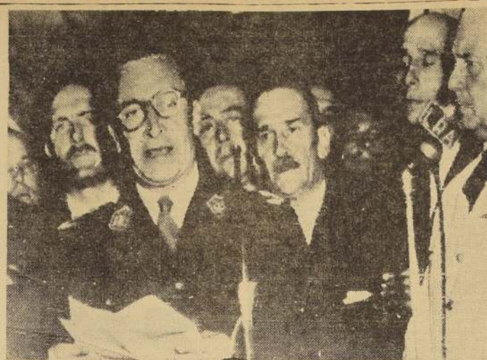
BUENOS AIRES. — El nuevo Presidente Provisional argentino, General Pedro Aramburu (centro), brinda con el viceministro Isaac Rojas (izquierda), Vicepresidente, y el Ministro de Marina, Teodoro Hartung. Aramburu sucedió al general Lonardi en la Presidencia de Argentina.

ORIGEN Y CAUSAS DE LA CRISIS ULTIMA. — El nuevo Gobierno inició sus tareas tras proclamar anoche que la crisis