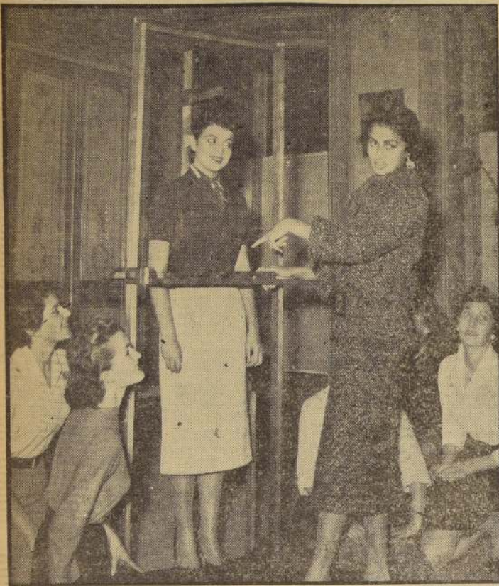
PARIS.— La agraciada y morena joven venezolana, recién proclamada “Miss Mundo”, visita la Escuela Parisiense de Modelos y se impone de su funcionamiento. Subida a la romana, que señala las privaciones a que deben someterse todas las jóvenes que desean conservar una atractiva silueta, “Miss Mundo” alterna con su amiga, “Miss Honduras”, que también ocupó un destacado lugar en este Concurso de Belleza.