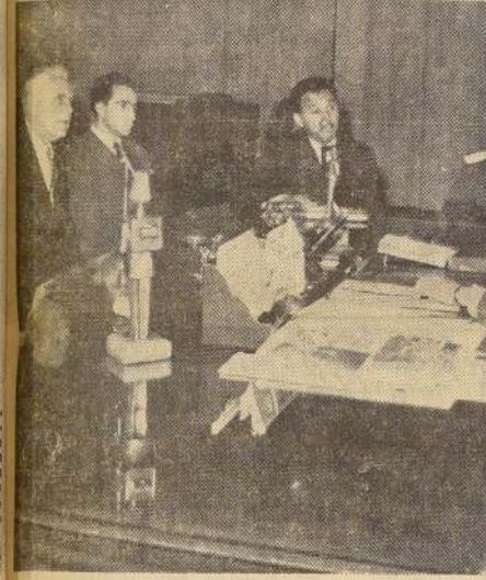
En la mañana del día de hoy, el Comité Ejecutivo del Consejo Nacional de Seguridad, presidido por el señor Carlos Ibáñez, vicepresidente del Consejo, se reunió en la sede del Consejo, para discutir el proyecto de convenio comercial con Gran Bretaña.