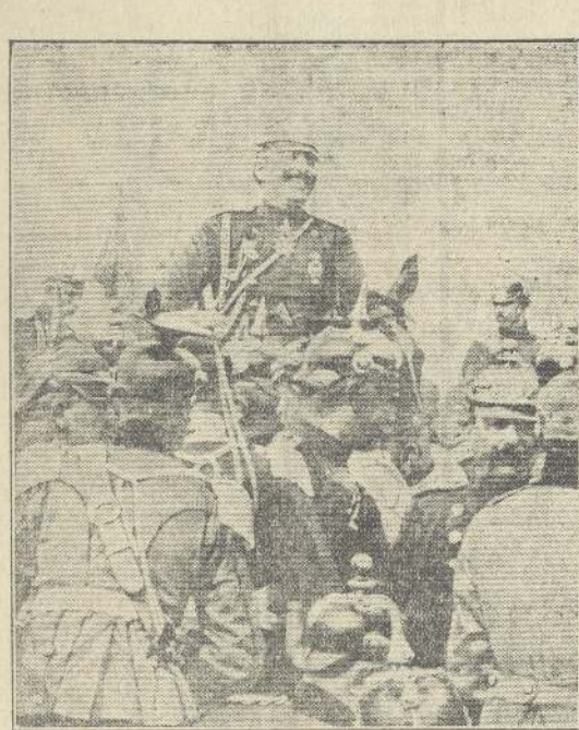
El Kaiser, entre sus soldados. Esta fotografía da una idea exacta de la familiaridad con que el Emperador Guillermo II se presentaba entre sus oficiales cuando asistía a las grandes maniobras de su Ejército, no hace muchos meses.—El cable ha comunicado que el Kaiser, al partir de Berlín para tomar el mando supremo de las tropas que operan contra Francia, se despidió de la capital con su característica sonrisa, que no abandonó ni en los momentos más difíciles.

Mr. Asquith, después de dar lectura a numerosas partes oficiales enviadas por el comando de las tropas inglesas,