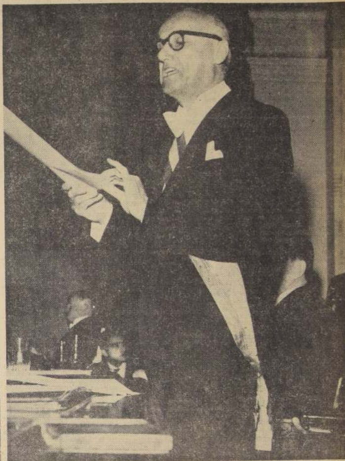
El Excmo. Sr. Alessandri lee su Mensaje ante el Congreso