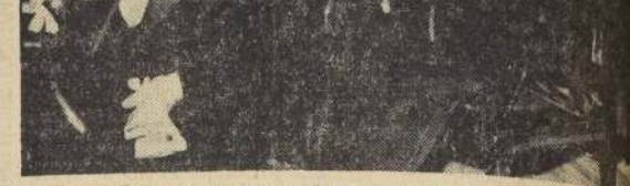
MINISTROS DE ESTADO DURANTE EL MENSAJE.— Los integrantes del Gobierno asistente Alessandri escuchan la lectura del documento en la sesión del Congreso.

El Ejecutivo continúa trabajando en una reforma de fondo del Arancel Aduanero, que reemplazará estas medidas de emergencia y transición a que me he referido, con miras a ponerlo de acuerdo con nuestro actual desarrollo industrial y con los fundamentales intereses del consumidor.