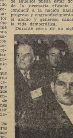
EL CONTRALOR GENERAL y los Comandantes en Jefes de las tres ramas de las FF. AA. y el General Director de Carabineros escucha el Mensaje del Presidente.