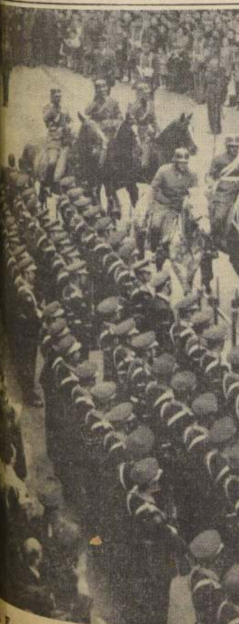
En su carroza y las FF. AA. le rinden honores, mientras el público le tributa su simpatía

Ese mismo público permaneció en sus puestos, durante todo el tiempo que el Presidente empleó en leer su primer Mensaje al Congreso.