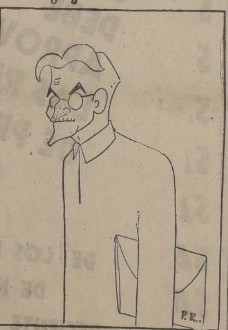
M. Paul Ramadier, Ministro francés de Defensa, quien ha hecho declaraciones optimistas sobre la potencialidad defensiva de la Unión Occidental.