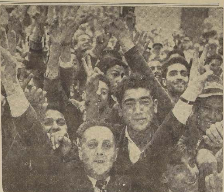
Esta notable fotografía muestra, en forma más elocuente que la mejor descripción, cómo han sido recibidas las fuerzas liberadoras en las ciudades del Norte de Italia y el espíritu que anima a sus pobladores. Escenas semejantes a la presente han sido presenciadas en las ciudades y campos de Sicilia, donde el pueblo ha recibido con no menor entusiasmo a los aliados.