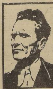
El General Tito

LONDRES, 18. — (U. P.).— La Radio El Cairo anunció que el Mariscal Tito resultó herido en las operaciones en Yugoslavia.