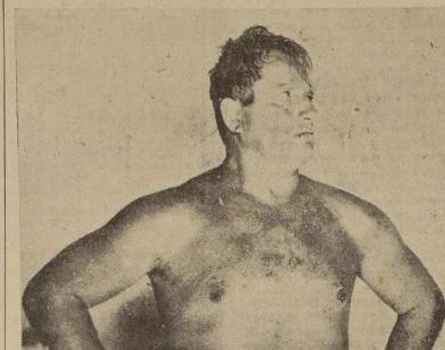
El renombrado campeón yugoslavo Tito Strika, que anteayer llegó a Chile desde Rio Janeiro y que actúa esta noche en el campeonato de catch del «Caupolicán»

Esta noche la segunda reunión con seis competencias con los seleccionados nacionales, el debut del yugoslavo Tito Strika y tres luchas internacionales