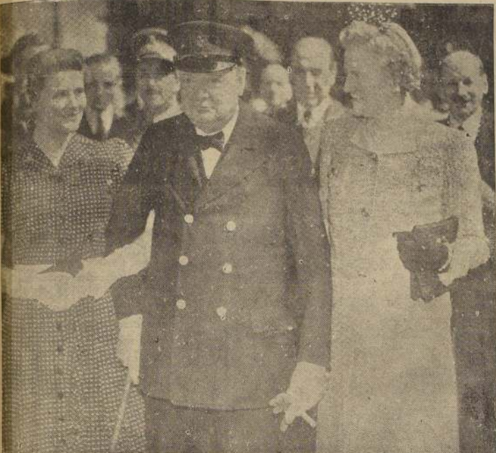
Churchill llega una vez más a Londres, de vuelta de Africa del Norte, completamente recuperado de la neumonía que lo aquejó en Africa del Norte. En el grabado aparece en compañía de su esposa y de una de sus hijas, que lo acompañaban a su regreso a la capital.

Churchill hizo una sensacional aparición ante los Comunes