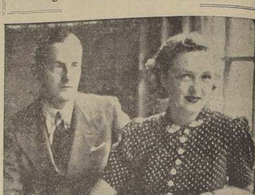
Lord Jersey, que acaba de divorciarse de la Condesa de Jersey, se casará ahora con Virginia Cherrill, estrella norteamericana de cine, que se hizo famosa en el film "Luces de la Ciudad", de Charles Chaplin.