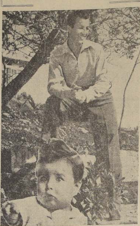
Robert Taylor, el galán preferido por todos los públicos femeninos, en dos épocas de su vida. De pie, ahora que goza de fama internacional como actor, y abajo, cuando aún no pensaba en el cine.