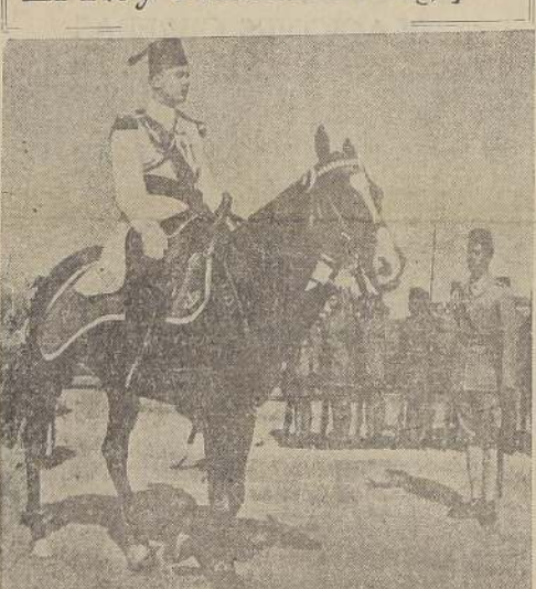
revisando a las tropas destacadas en el Cairo con motivo de la reciente entronización del citado monarca.

a los siguientes precios: para entrega e agosto se cotizó a 9.31. Para entrega en noviembre se cotizó a 9.37. NUEVA YORK, 2. — (U. P.) — Los precios fijados para el algodón al cierre de este mercado han sido los siguientes, en centavos por libras por entrega en las fechas que se indican: Octubre, 9.18. Diciembre, 9.15. Enero (1938), 9.20. Marzo (1938), 9.29. Mayo (1938), 9.37. NUEVA YORK, 2. — (U. P.) — El mercado del algodón cerró