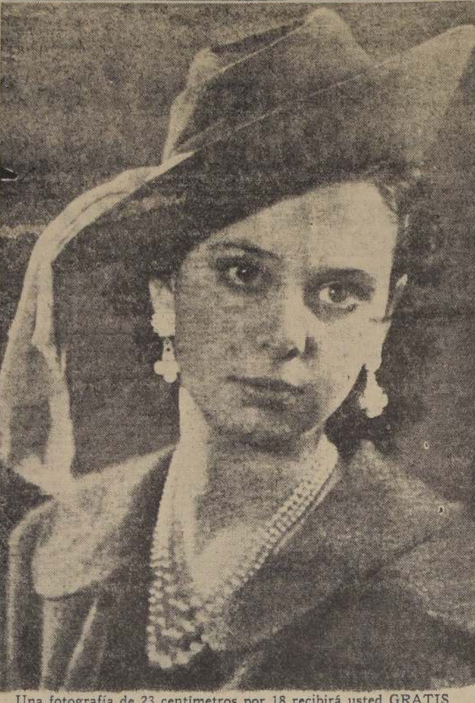
Una fotografía de 23 centímetros por 18 recibirá usted GRATIS colocando un AVISO ECONOMICO EN ESTA SECCION Por cada AVISO ECONOMICO que usted coloque, solicite en la CAJA UN CUPON que le da derecho a una hermosa fotogra- fía de los Estudios Fotográficos TIMAR, Nueva York 47

CHALET MODERNO SEIS PIE- zas, baño instalado y dependien- cias, arriendase, tratar Avda. Brasil N.º 750. 8 Julio