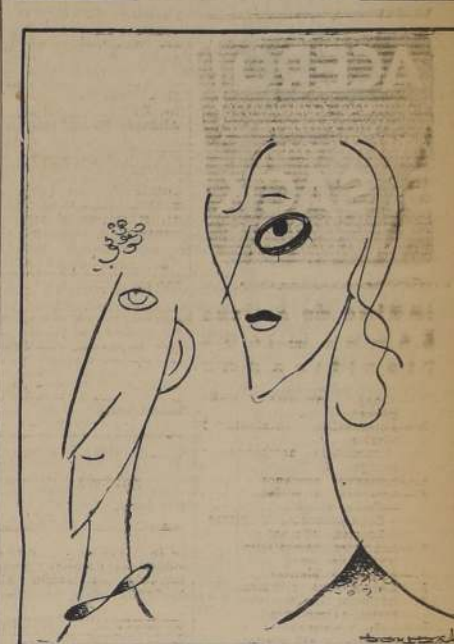
JEAN COCTEAU Y BERTA SINGERMAN. AUTOR E INTERPRETE DE "LA VOZ HUMANA"