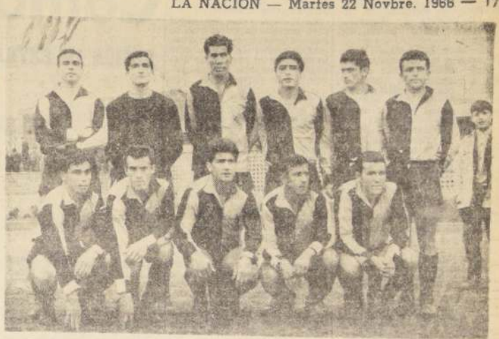
Coquimbo Unido repitió la gracia de la primera rueda y derrotó por segunda vez a Huachipato, el líder del Ascenso, acortando a seis los puntos que los separan.

Dentro del relativo interés que presenta el Ascenso en su movimiento en la tabla de posiciones, no podríamos dejar de mencionar el repunte que ha experimentado en las últimas fechas el elenco de Ovalle. Parece que están soplando buenos vientos ahora en la nortina institución, más aún después del contundente triunfo sobre Trasandino, que mal que mal, va cuartito en el puntaje. Aunque tenemos que reconocer que en el club de Los Andes las cosas han andado un poco turbias, con muchos problemas con algunos titulares, déficit económico y otras vicisitudes que naturalmente tienen que influir decisivamente en el rendimiento de los jugadores.