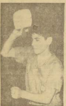
BIRIBIRA: Principal figura del torneo internacional de febrero.

Si no se producen inconvenientes la temporada se efectuará a mediados de febrero, teniendo como escenario el Club Unión de la Federación de Basquetbol o el local de la Universidad Católica.