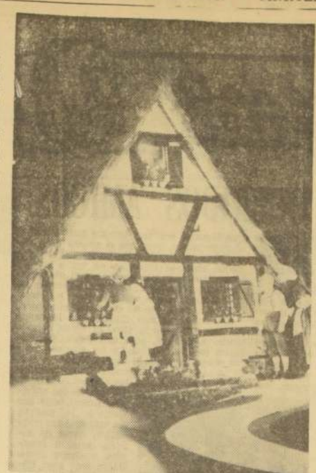
LA CASA DEL ABUELITO. El grabado muestra uno de los decorados de Raúl Allaga para "El Pájaro Azul", de Macerlinck, que el Teatro Universitario de Concepción presentó ante 5 mil penquisas que asistieron al Foro Abierto de esa ciudad. Los pequeños protagonistas de la obra llegan a la casa de sus abuelitos en busca del "Pájaro Azul", que simboliza la felicidad. El espectáculo se repite mañana, y seguramente contará con otros 5 mil espectadores.