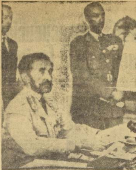
ADDIS ABABA. — El Emperador de Etiopía, Haile Selassie, es fotografiado durante una conferencia de prensa que ofreció aquí en el Palacio Imperial. Señaló que estaba investigando la posibilidad de que una potencia extranjera hubiera ayudado a los rebeldes que intentaron derrocar su Gobierno.

Más adelante Kubitschek afirmó que "somos una nación cristiana. No es cristiana una nación indiferente a la miseria y al subdesarrollo con toda su secuela de horrores".