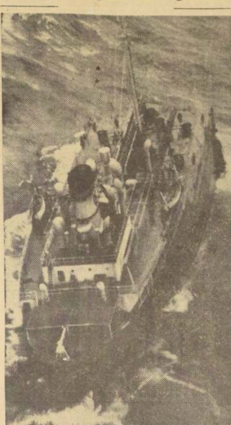
La popa del petrolero americano "Pine Ridge", destrozado por una tormenta el 21 de diciembre recién pasado. Los sobrevivientes pueden verse en la parte de la nave y cinco más en el agua.