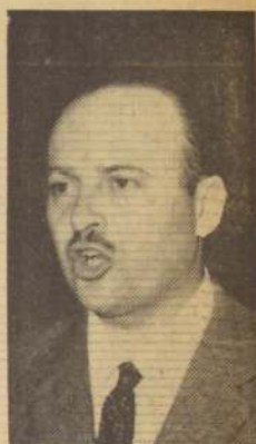
MINISTRO del Trabajo, Hugo Gálvez.

Más adelante el Ministro Gálvez recordó lo sucedido en algunas faenas de las firmas relacionadas con la construc- ción como "Pizarro", Ce- mento "Cerro Blanco" de Pol- paico y otras.