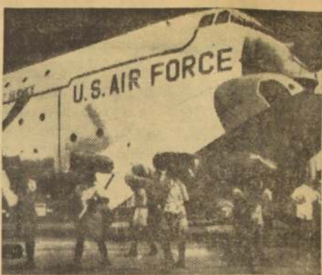
LEOPOLDVILLE. — Cuatrocientos policías nigerianos arriban a esta ciudad para reemplazar a las heridas tropas de Ghana que prestan servicios a la ONU.

Los desechos dijeron que el atentado fue obra de antibonapartistas.