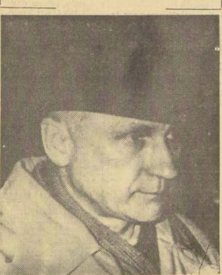
El mayor Richard Baer, comandante del campo de Aus- tria, detenido el 21 de diciembre por la policía. Baer estuvo oculto durante 15 años como el leñador Kurt Neumann, en la estancia del príncipe Otto von Bismark. Baer fue conde- nado a muerte en rebeldía por el Tribunal de Nuremberg.