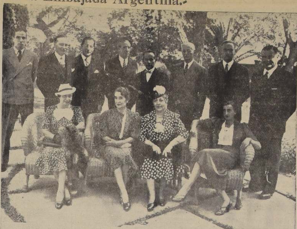
Asistentes al almuerzo ofrecido ayer en la Embajada de Argentina en honor de los abogados bonaerenses que visitan Santiago.