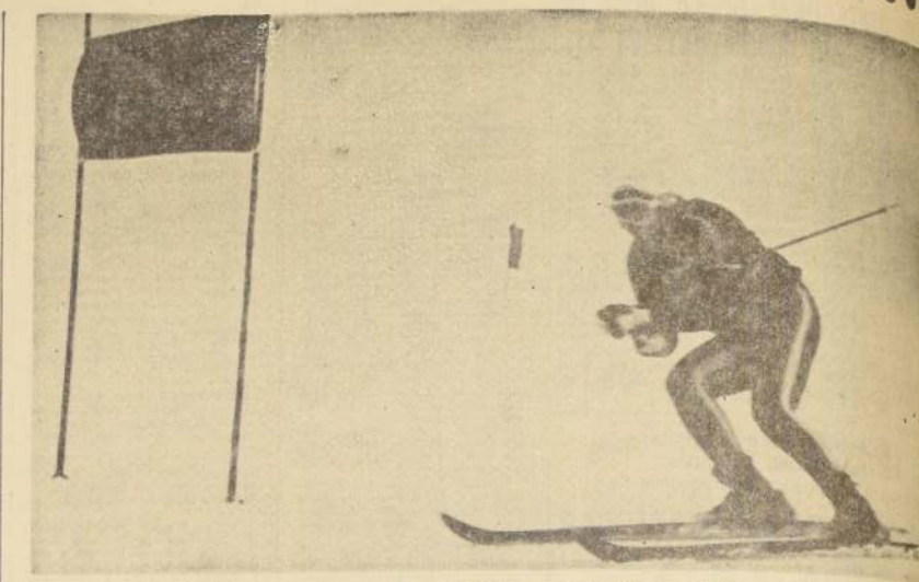
Con sus bastones bajo los brazos y empezando a detenerse, llegar a la meta del Slalom Gigante y clasificarse Campeona Mundial, captó nuestro reportero gráfico a Marielle Goitschel.

Y hoy, recibimos una invitación a un cóctel de la Prensa Europea para los colegas chilenos. O sea, una fórmula de desagravio para con nosotros.