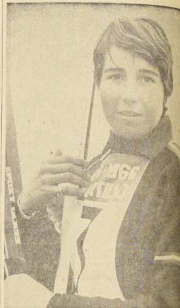
Marielle Goitschel. — Ratificó en Portillo su título de mejor esquiadora del mundo.

"Estoy muy satisfecha, ya que en cierto modo, al final de mi carrera, he ganado una medalla de oro."