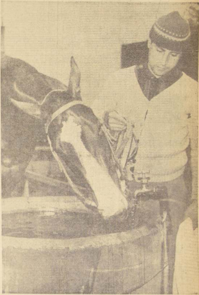
Polymer (Náucide y Quimera II) ha corrido en seis ocasiones. Su victoria en 1.100 metros en su 2ª actuación. Luego ninguna figuración.

Una carrera que atrae y, seguramente, servirá para aclarar ya el panorama aún confuso.