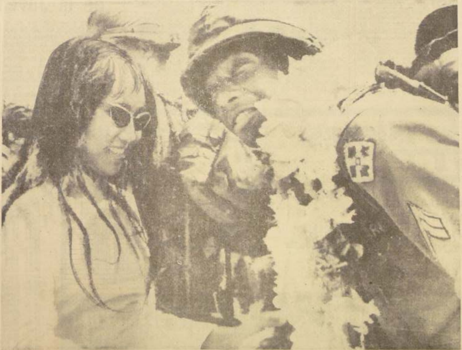
QUI NHOM, Vietnam del Sur.— Al llegar la Segunda Brigada de la 4a. División de Infantería de los EE. UU., uno de los soldados recibe la bienvenida de una gentil vietnamita, la que le coloca una guirnalda de flores.

También se escucharon hasta las primeras horas de hoy disparos de ametralladoras en varios sitios de la ciudad y se informó de la muerte de una persona como consecuencia de los tiroteos, cuyo origen no fue aclarado.