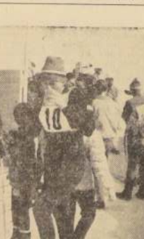
Los participantes al Campeonato Mundial de Esquí en Portillo se reanuda después de las pruebas con Caldo MAGGI, en los stands especialmente instalados en el recinto mismo de la meta.

El Directorio, acordó solicitar de la Central de Fútbol, copia de informe presentado por el presidente de la delegación en que se refiere en parte, a la labor de la prensa deportiva.