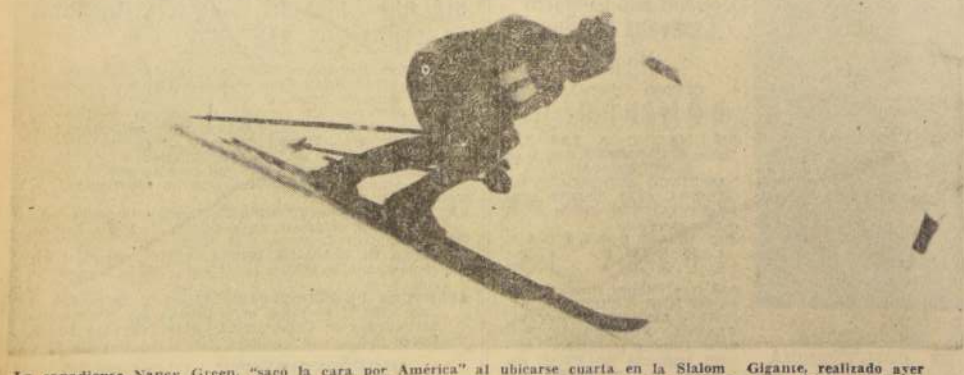
La canadiense Nancy Greene, "sacó la cara por América" al ubicarse cuarta en el Slalom Gigante, realizado ayer en Portillo. Su actuación la destacada como la única representante, de estos continentes clasificadas.