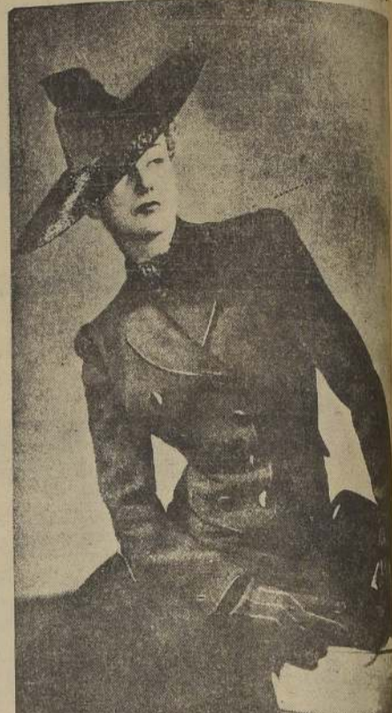
CREED.— Traje estilo sastre, de lana negra, para la tarde. Falda en forma; chaqueta con vivos y botones de satén negro. Sombrero, de ROSE VALOIS, de paja negra brillante y gros-grain punteado. Guantes, de ILDA, de antilope negro, pespunteado a mano con tiras de cabritilla.

El uso del alcohol "es tan vehementemente practicado, individual-