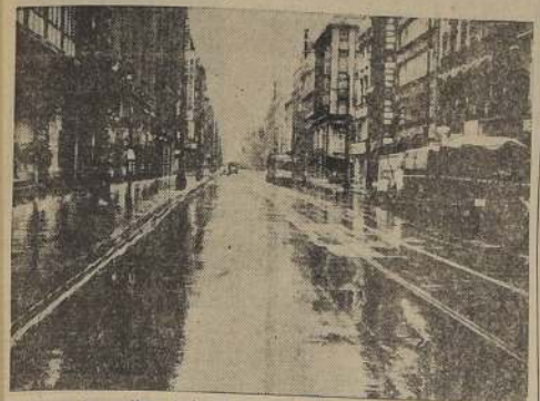
Nadie en las calles: todo el mundo está en su casa pegado de los altoparlantes de la radio