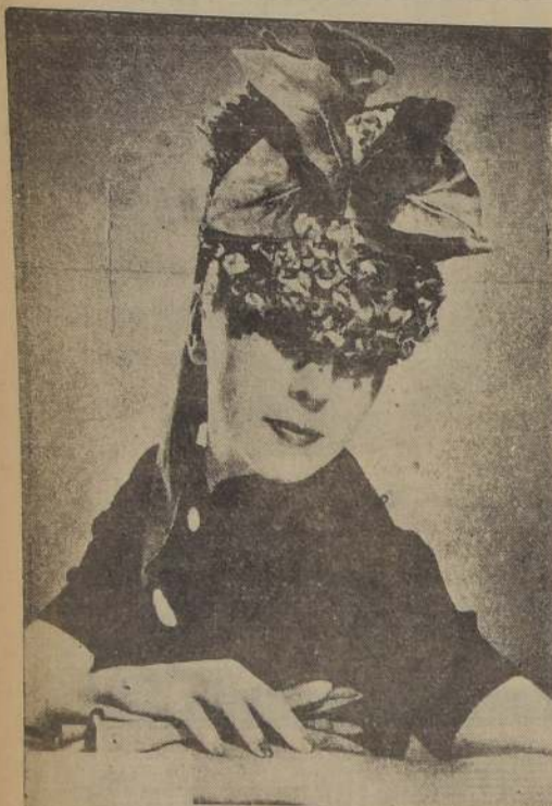
SCHIAPARELLI.— Sombrero diminuto compuesto de violetas y hojas verdes, adornado con cinta de terciopelo cereza. Vestido negro y guantes color cereza.