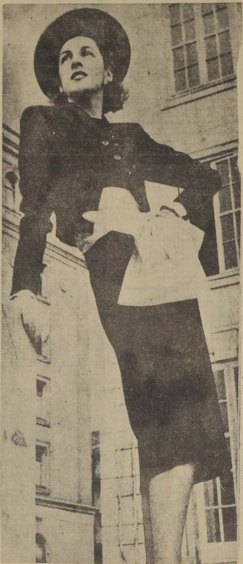
MOLYNEUX.— Vestido y bolero de lana del color verde muy oscuro, llamado "verde marino". Cinturón blanco, incrustado, de moaré albeña mate, que cruza en la espalda y se ata adelante con un gran moño.

Porque las personas que usan Revlon pueden mantener las uñas más largas y fuertes