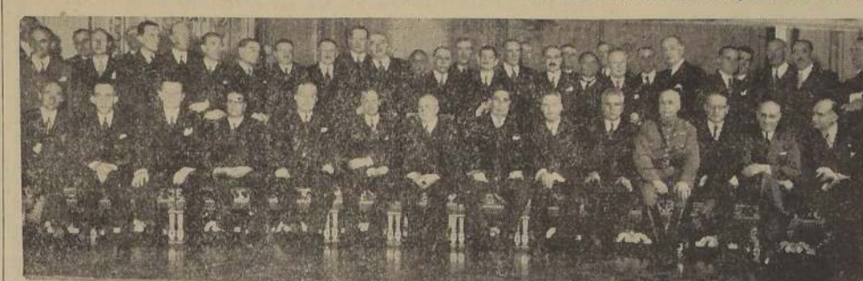
Asistentes al almuerzo ofrecido al señor Embajador de Estados Unidos de Norte América en el Club de la Unión.

En el Club de la Unión, se efectuó ayer el almuerzo en honor del Embajador de Estados Unidos, Excmo. señor Norman Armour, que ha sido designado para desempeñar igual cargo en la República Argentina.