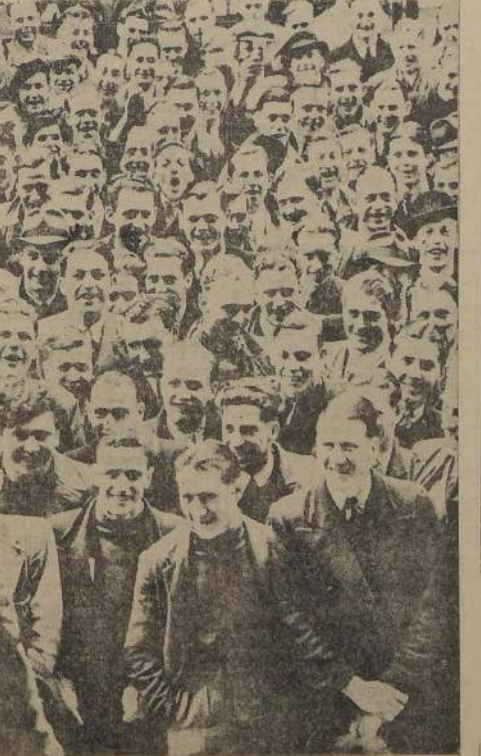
Millares de muchachos como estos han acudido en Gran Bretaña a inscribirse en los registros militares. Sus caras sonrientes han causado gustosos a servir a la patria.