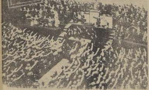
En el revuelto en que habia el Fuehrer, el Reichstag, todo el mundo levanta el brazo y grita "Heil, Hitler!"