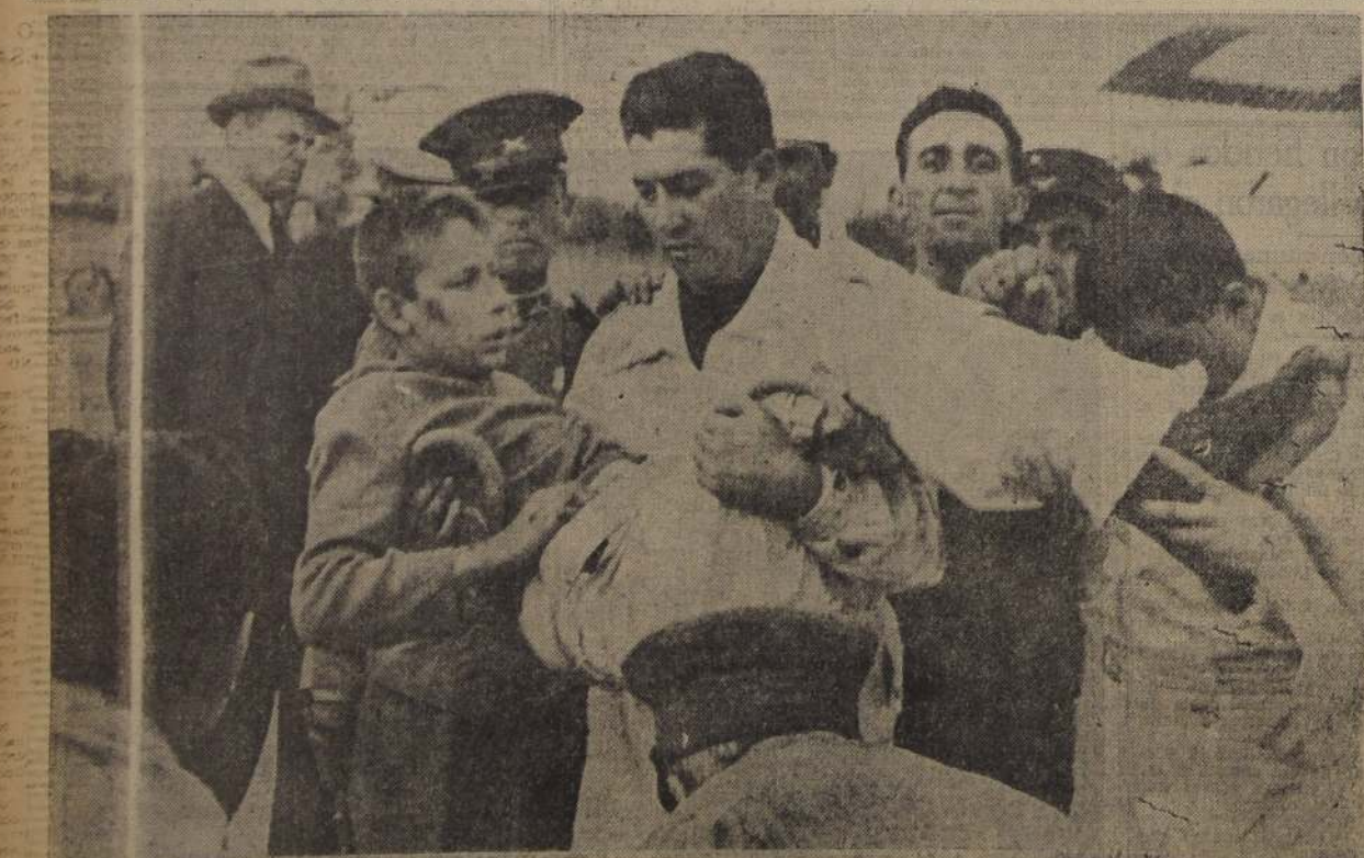
Un muchacho del pueblo, que salvó con vida, mas no ileso, sino con graves y dolorosas heridas, al igual que decenas y decenas de heridos transportados por los aviones a la capital, es llevado cuidadosamente hasta una de las ambulancias, después de haber sido rescatado del avión que lo trajo a Santiago

Se reunió comisión de reconstrucción de zona devastada. Ayer se reunió la comisión de reconstrucción de la zona devastada por el terremoto. La comisión está compuesta por representantes del Gobierno y de la comunidad, y se reunirá regularmente para discutir los planes de reconstrucción.