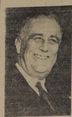
PRESIDENTE ROOSEVELT contestó a Hitler aumentando la línea de defensa del Hemisferio Occidental

Los congresales que tomaron parte en la conferencia secreta con el Presidente, han dado a entender que quedaron impresionados por la especial preocupación del Presidente por el Hemisferio Occidental y anticipan