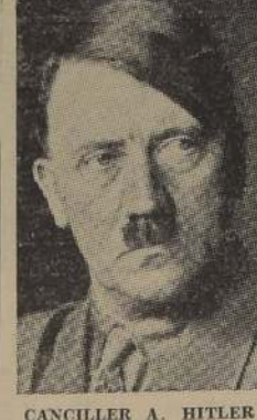
CANCELLER A. HITLER

Se dice que el Reichstag determinó las declaraciones del Primer Mandatario de E.E. UU.