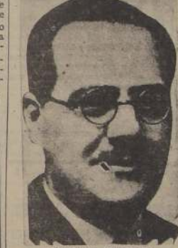
PREMIER NEGRIN Habla ayer en Consejo de Ministros habilitado en Figueras

Después de la lucha en las afueras de Madrid y Alcañiz de Huesca, Jurada se hizo cargo del cuarto cuerpo de ejército.