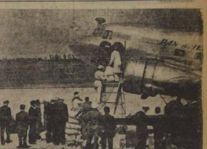
Desde la modesta carreta hasta el avión, han empleado las autoridades para la evacuación de los heridos y damnificados de las ciudades asoladas por el terremoto