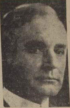
CORDEHL HULL Presidente de la Unión Panamericana, que cooperará a la ayuda

Toda clase de instituciones, oficiales y particulares, en todo el territorio argentino presta su cooperación. — Una comisión nombrada por Getulio Vargas coordinará la ayuda de la nación brasileña. — Cinco aviones militares y un vapor brasileño partirán en breve a Chile. — Un llamado de Mr. Roosevelt al pueblo norteamericano. — Cada vez encuentra más ambiente el proyecto del diputado Fish sobre el millón de dólares