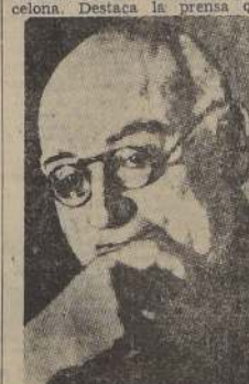
GENERAL MIAJA Sus hombres en Madrid están listos para la resistencia

La Academia oyó después el informe de Eugene Pepin, juriscónsul agregado al Ministerio de Relaciones Exteriores francés, sobre panamericanismo y la Conferencia de Lima, en el cual establece un paralelismo entre la declaración de Lima de Cordell Hull y la enuncianción de la Doctrina Monroe en 1923.