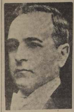
GETULIO VARGAS Nombró una Comisión de Coordinación pro ayuda a los damnificados

La resolución pide instrucciones en el sentido de que copias de la misma sean enviadas inmediatamente a todas las entidades de Cruz Roja y organizaciones similares de todo el Hemisferio.