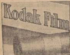
Para fotografías de las que ganan premios, dícele Película Kodak: "la película de la caja amarilla es segura."

Quedan 343 premios, con un total de m/c de $7,000 m/c para Chile y los vencedores de cada clase tomarán parte automática mente en el jurado internacional de $132,000 m/c en total de premios, más medallas, un trofeo y fama mundial.