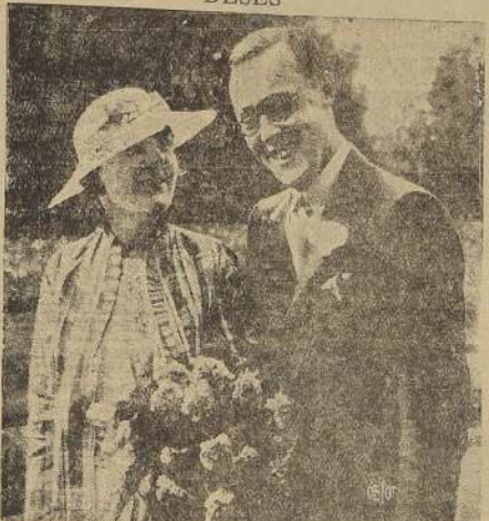
La princesa Juliana, heredera del trono de Holanda y su marido el Príncipe Bernardo de Lippe

LONDRES, 13 (U. P.).— La Reina Guillermina, al descender del tren a su llegada a Londres, parecía triste y desesperada. Fue recibida por el Rey Jorge, la Princesa Juliana y el Príncipe Consorte Bernardo. — Esos últimos la habían precedido acompañados de hijos. — Un comunicado oficial holandés dice que la Reina y sus Ministros se han "trasladado a otro punto". El jefe del Estado Mayor, general Winkelman, lanzó la siguiente proclama: "A todo el pueblo holandés. En estos tiempos difíciles, apelo a vuestra unidad para que haya orden y calma en el interior del país y disciplina en el frente". La Reina de Amsterdam, a las 12.30 P. M. (hora estándar británica), había anunciado que la Princesa Juliana, el Príncipe Bernardo y sus hijas las princesas Beatrix e Irene se encuentran en Londres, agregando: "La población se impresionará con satisfacción que la Casa de Orange, cuando venga lo peor, se halle en seguridad. El Príncipe Bernardo, acompañado a su esposa e hijos, volverá tan pronto como le sea posible a reanudar su deber como ayudante de campo de la Majestad la Reina".