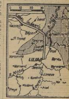
La zona rayada verticalmente señala la cuna introducida por los alemanes en territorio belga, a través de Holanda, hasta llegar a Warehem, donde el invasor fue contenido

lidas a severa prueba por la arremetida alemana. Tres divisiones blindadas alemanas avanzan en forma de punta de lanza en un tremendo esfuerzo coordinado a flaquear las defensas del Canal Alberto, lo que les abriría el camino hacia los puentes de la costa belga. Detrás de esas unidades mecanizadas avanzan poderosas fuerzas de apoyo con un respaldo aéreo devastador.