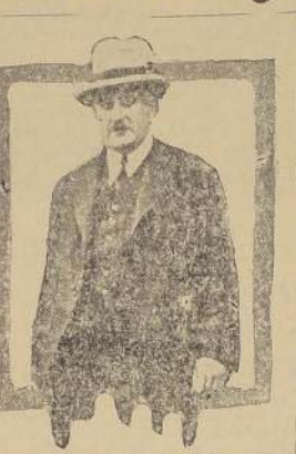
con el cargo de Notario de Villarrica. En 1906 ocupó el delicado cargo de juez en este mismo departamento. En 1907 pasó a desempeñar iguales funciones en Rengo, donde estuvo hasta 1911, cuando fue designado para ocupar el cargo de Jefe de la Sección de Medicina de Valparaíso.

Su carrera como funcionario público, puede decirse que la inició el año 1904.