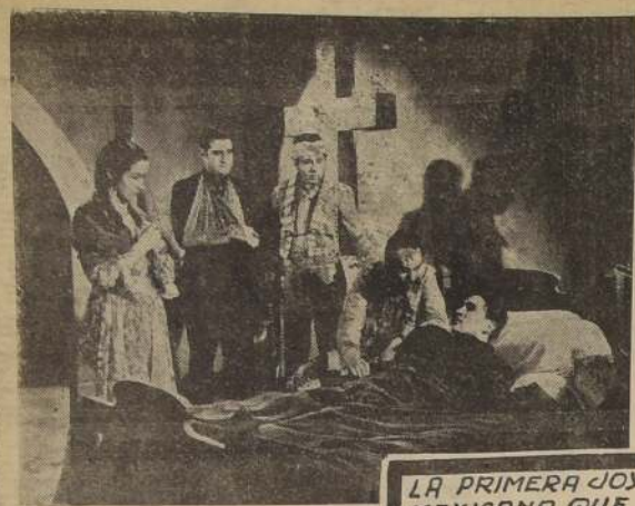
LA PRIMERA JOYA MEXICANA QUE PRESENTA EN CHILE "STAR FILM"