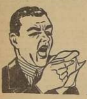
A los primeros síntomas

para combatir RESFRIADOS CATARROS Y GRIPE