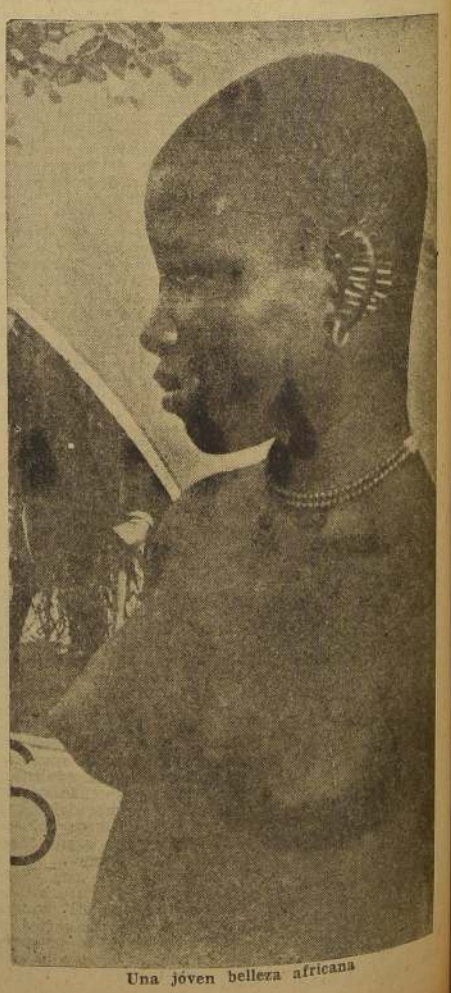
Una joven belleza africana