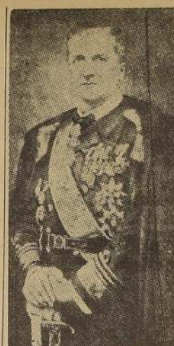
Nicolás Horthy, Regente de Hungría.