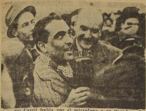
Hugo del Carril habla por el micrófono a su llegada a Los Cerrillos, ayer tarde