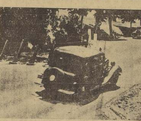
La presente fotografía, que le costó la pérdida de la libertad al listo y desenvuelto corresponsal gráfico que acortó a tomarla, muestra las fuertes estacas de acero colocadas por las autoridades de Danzig para detener un posible avance de los carros de asalto de Polonia

DANZIG, 19.— (U. P.) — Los habitantes de Danzig que vieron ayer el primer desfile militar oficial en la Ciudad Libre desde la guerra mundial, han comenzado a darse cuenta del temor que ha espantado por Europa la creciente tensión de los últimos días. Sin embargo, el danzigués medio aún no ha renunciado a la esperanza acrisolada durante meses de que Danzig vuelva este año pacíficamente al Reich.