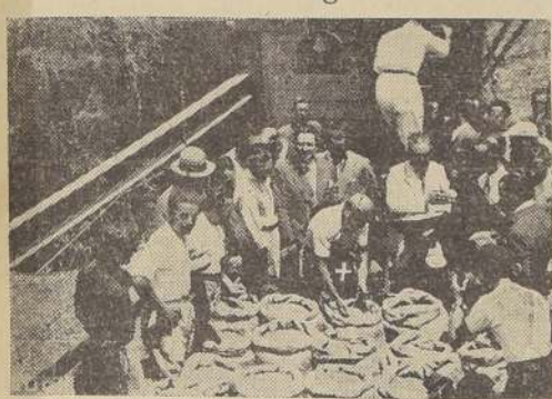
El Duce participa en la trilla del primer trigo de Littoria (Sabaudia), junto con los campesinos.