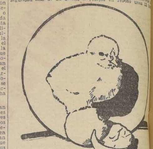
La selección cuidadosa de los huevos, dará como resultado vigorosos pollitos.

Muchas veces hemos oído las quejas de los aficionados a la equitación por los errores o las equivocaciones, a pesar de haber servido con exactitud las instrucciones dadas. Generalmente se cree que la causa o la causa principal, ha sido la causa de ello, y la persona se decepciona al no obtener el resultado que esperaba. Pero, ¿qué puede ser más de un detalle no