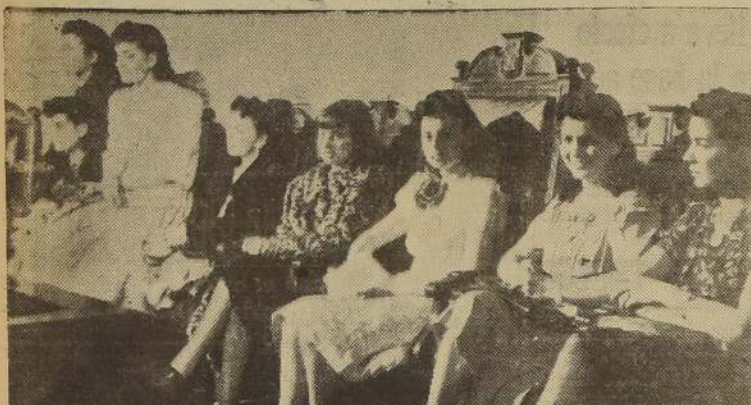
La Reina de la Primavera y sus Damas de Honor, durante el acto de la proclamación efectuada ayer en la Universidad de Chile

El acto se efectuó en la Universidad de Chile. — El Consejo de LA NACION ofrecerá hoy un cocktail en su honor