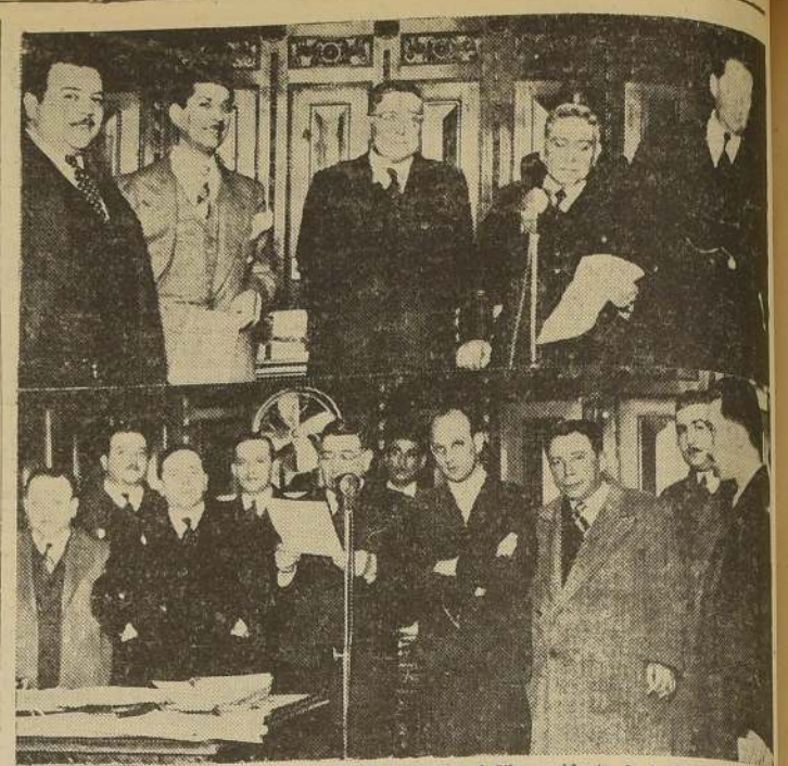
En el presente grabado aparecen, en la parte superior, el Vicepresidente de la República Excmo. señor Jerónimo Méndez leyendo su mensaje al país; en la parte inferior, el Ministro del Interior señor Leonardo Guzmán, dando lectura a su declaración.

Es también miembro de la Sociedad Bolivariana del Ecuador; del Instituto Geográfico de Lima; del Instituto de la Orden de Abogados del Brasil; de la Comisión Nacional Coordinadora del Ecuador; y presidente de la Sociedad Bolivariana de la Paz.