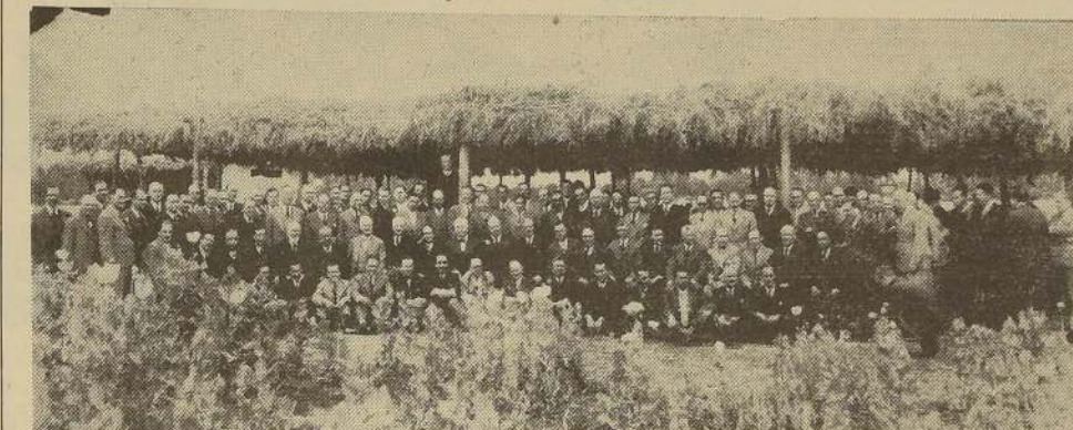
Asistentes al almuerzo ofrecido por los Rotarios de Chile al Embajador de Bolivia, Excmo. señor Hernando Siles en el fundo Palermo

LUCY KINGLÉN Y SUS ALUMNAS. Esta distinguida maestra de danzas ofrece un hermoso y variado recital con sus alumnas el viernes 14 del presente, en el Teatro Club de Señoras a las 18.45 horas. El programa consulta música escogidísima de autores clásicos y modernos; se interpretará el hermoso ballet