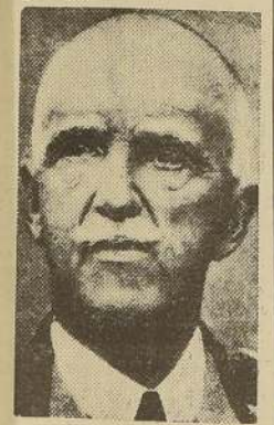
S. M. Víctor Manuel III, Rey de Italia, cuyo aniversario de su natalicio se celebra hoy.

La Cruz Roja ha logrado hacer universal su acción y sus prestigios por la inspiración generosa que la anima y el positivo bien que ha hecho. Su símbolo recorre el mundo como un emblema de paz y de caridad. — Marcelo T. de Alvear, Presidente de la República Argentina.