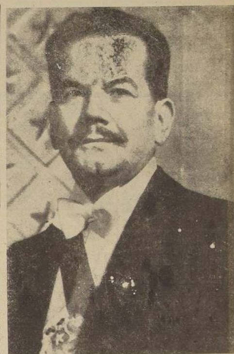
S. E. el Presidente de la República Excmo. Sr. Pedro Aguirre Cerda