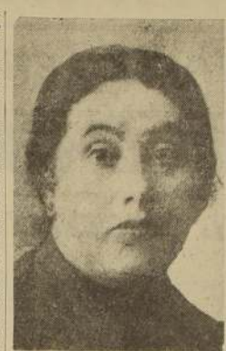
con la modestia que fué tradicional en ella a través de toda su generosa existencia.