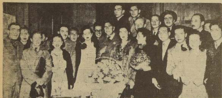
La Reina de la Primavera y sus Damas de Honor, durante la visita que hicieron ayer a LA NACION

CURSO "GREGG" PARA FORMAR TAQUIGRAFOS EL SISTEMA MASCORTO FACIL DEL MUNDO