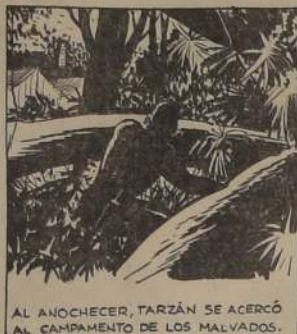
AL ANOCHECER, TARZAN SE ACERCÓ AL CAMPAMENTO DE LOS MALVADOS.