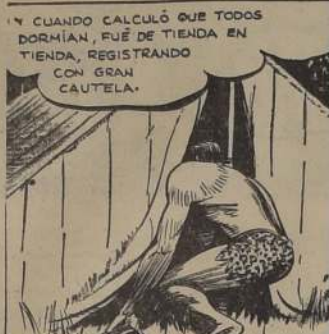
Y CUANDO CALCULÓ QUE TODOS DORMÍAN, FUE DE TIENDA EN TIENDA, REGISTRANDO CON GRAN CAUTELA.