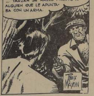
TARZAN SE HALLÓ FRENTE A ALGUIEN QUE LE APUNTA-BA CON UNA ARMA.