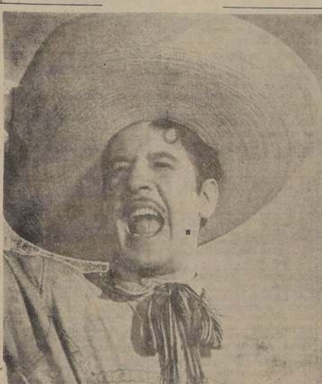
"PEDRO INFANTE, EL GALAN DE MODA DE LA CINEMATOGRAFIA MEXICANA"

Por el interés que ha despertado el nuevo galán Pedro Infante, se desprende que el estreno de "Cuando lloran los valientes", será todo un éxito comercial para Cinematográfica Ibarra, firma distribuidora de la película que se empezará a exhibir desde hoy en la pantalla del Teatro Central. Con esta película, Pedro Infante, considerado como el sucesor de Jorge Negrete y el galán de mayor popularidad en México, logra tal vez su mejor interpretación cinematográfica, en un papel de redentor, en un argumento que hará las delicias del público por el interés de su trama y la acción de sus personajes y situaciones. Acción en este film de carácter extraordinario, Víctor Manuel Mendoza, Virginia Serret, Blanca Estela Pavón, Ramón Valderrama, Mimi Derba, Agustín Isunza, Eduardo Casado y el famoso actor cómico "El Chicote", junto a otros actores del numeroso repertorio de esta película mexicana.