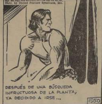
DESPUÉS DE UNA BÚSQUEDA INFRACTUOSA DE LA PLANTA, YA DECIDIÓ A IRSE...