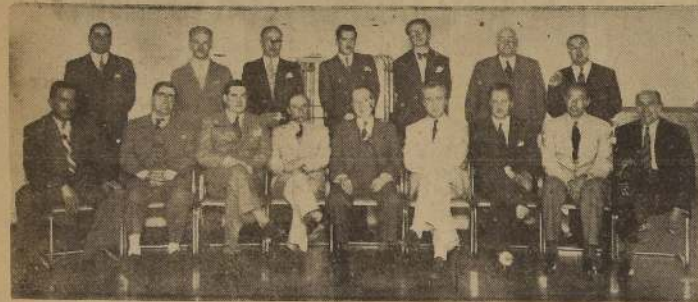
Almuerzo ofrecido por la firma constructora "Soc. Guillermo Frank" con motivo de la entrega a la Caja de EE. PP. y PP. del edificio de renta de O'Higgins esquina de Testinos.

A las 13 horas de ayer se dio a efecto en los comedores del "Epitafio" el almuerzo que la firma constructora "Frank", con motivo de la entrega e inauguración del edificio de renta, que esta firma construyó para la Caja de Empleados Públicos y Periodistas, ubicado en Avda. B. O'Higgins esquina de Testinos.