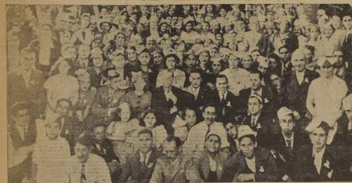
Dirigentes, socios y familias asistentes a las brillantes festividades con que celebró su primer aniversario el Sindicato Industrial Obrero Ferrilloza.

La Mesa Directiva y delegados de este organismo visitarán hoy al Comisario General de Subsistencias