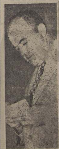
Rollin Atwood, funcionario del Departamento de Estado de Estados Unidos, que recientemente visitó nuestro país y que elevó un muy favorable informe sobre Chile

En resumen, las respuestas dadas por el Presidente Truman a las interrogaciones de la prensa, no significan ningún cambio en esta situación".