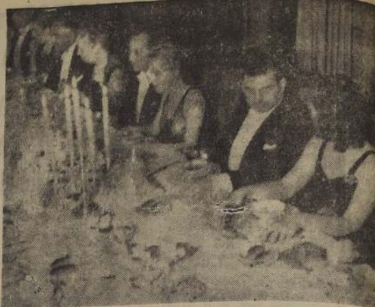
EN HONOR DEL MINISTRO DE RELACIONES EXTERIORES Y SEÑORAS ASISTENTES a la comida ofrecida por el Embajador de México, y señoras la sede de la Embajada, el miércoles pasado, en honor del Ministro Rios, y señora de Walker.