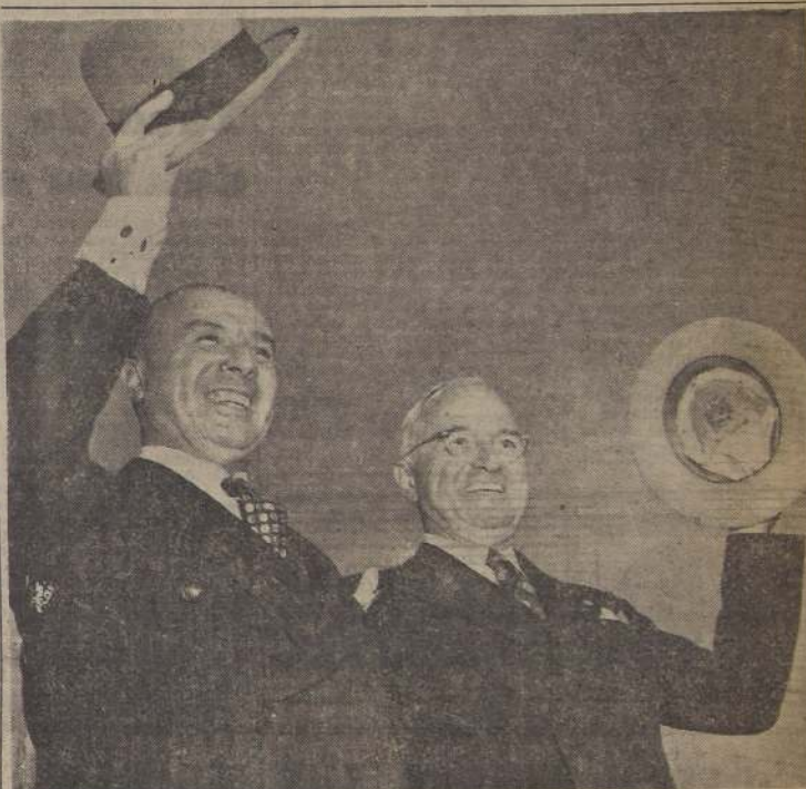
El Excmo. señor González Videla y el Presidente Truman, durante la visita que el Mandatario chi- leno realizó a Estados Unidos, cuyos efectos se palparán ahora, al anunciarse que Norte América pondrá en práctica su colaboración para hacer realidad el Punto Cuarto del Plan Truman.— La Cancillería chilena anunció el envío de misiones técnicas para lograr el progreso de las diversas actividades nacionales

El Excmo. señor González Videla expresó a la prensa que esta ayuda efectiva que la gran nación americana pre- staba a Chile para el desarro- llo de su economía, y para la resolución de problemas de tanta trascendencia como son los relativos a la educación y las habitaciones para el pue-