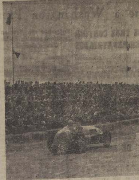
EL AS MUNDIAL.— Juan Manuel Fangio capitaneará el equipo de corredores argentinos que participará en el Circuito Pedro de Valdivia Norte, el domingo 17. En el grabado lo vemos corriendo en un Ferrari en el Gran Premio de Reims, donde obtuvo una brillante actuación.

Con el objeto de darle el mayor realce posible a esta prueba, el Audax alige gestionando la venida del crack francés Louis Rosier. Este corredor pide una suma cercana a los 300 mil pesos por participar. La entidad italiana, cobrigráficamente, le ha formulado una contra-oferta, esperándose respuesta hoy.