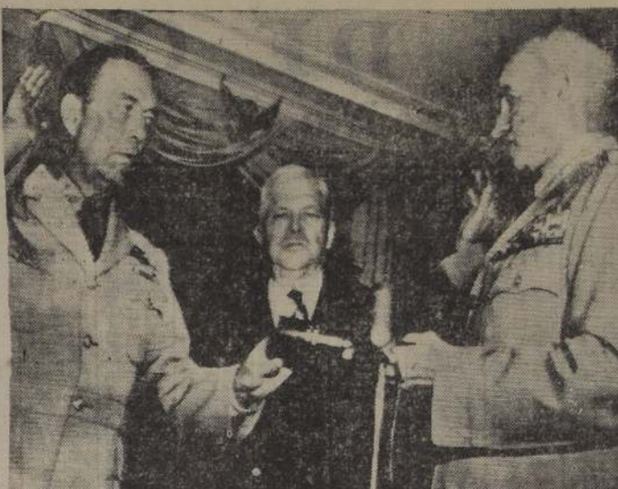
WASHINGTON, 15. (UP).— El almirante Arthur W. Radford (a la izquierda), presta juramento como nuevo jefe del Estado Mayor, durante una ceremonia en el Pentagono. Este fue el último acto oficial del Ministro de Defensa, Charles B. Wilson, al centro.

REUNION DEL LUNES. — La Asamblea General se reúne el lunes para nombrar los países que han de representar a la conferencia política. Los comunistas nombrarán sus propios representantes.