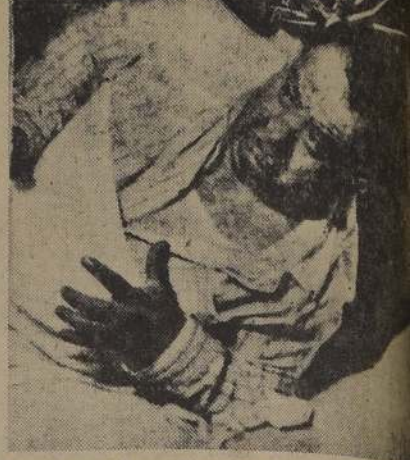
Pesadillas con el Diablo, con trenes que se vienen encima, arañas, suelen causar daños irreparables al estado mental de quien las padece.

¿Qué más conoce la ciencia acerca de la ideación nocturna? Bueno, los científicos saben que las mujeres sueñan más que los hombres (o, estrictamente hablando, son más conscientes de su vida soñan-