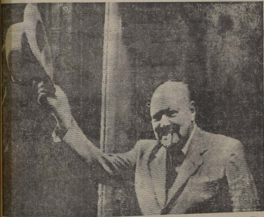
EL HOMBRE DE LA "V" DE LA VICTORIA.— LONDRES.— Fumando su inevitable puro, el Primer Ministro Winston Churchill saluda a los fotógrafos cuando regresa a su residencia de Downing Street 10, después de haber permanecido durante un tiempo en su residencia de campo, para restablecerse de una molesta enfermedad.