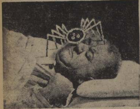
Son frecuentes las pesadillas como ésta. Las producen, a veces, comidas demasiado pesadas.

Cuando usted dice a alguien: "anoche tuve un sueño", relata-