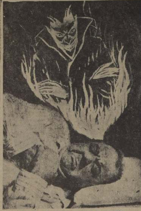
De cada tres sueños, uno sólo es agradable

Ruidos nocturnos, pies fríos, colecciones defectuosas, o trastornos digestivos está demostrado que provocan sueños especiales. Por ejemplo: la caída al suelo de las ropas de cama-