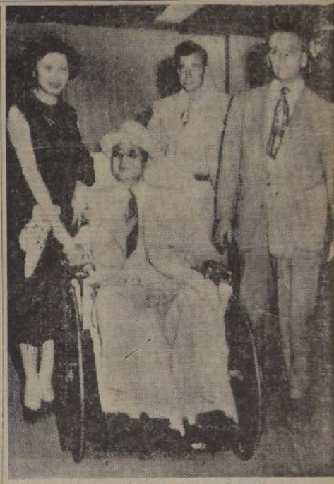
PRESIDENTE FILIPINO FUE OPERADO DE ULCERAS.— BALTIMORE.— Elpidio Quirino, Presidente de las Filipinas (en el sillón) al abandonar el hospital donde fue sometido a una delicada operación de sus úlceras estomacales. A la izquierda está su hijo, que es esposo de Luis González. Quirino conferenciará con los jefes militares americanos aquí, de regresar a las Filipinas.

donde se les ha provisto de refugios provisionales, alimentos y atención médica. De las islas todavía se eleva el humo de los incendios mientras continúan pequeños temblores de tierra. Todo está cubierto con una capa de polvo y ceniza. En Zante se terminó el pan y los panaderos de los cruceros Gambia y Bermudas están horneando rápidamente grandes cantidades para alimentar a la población que ha sido reagrupada en campamentos, uno al sur, donde hay más de 3.000 personas, y otros al norte de la capital de la isla, donde hay más de 1.000. Camiones con alimentos y ambulancias están listos para partir al interior de las islas, tan pronto como se logren establecer los caminos, aunque se tiene entendido que debido a la destrucción de los puentes y a los deslizamientos de tierras, el trabajo demorará varios días. El observatorio de Atenas informó que 10 nuevos temblores de menor intensidad volvieron a