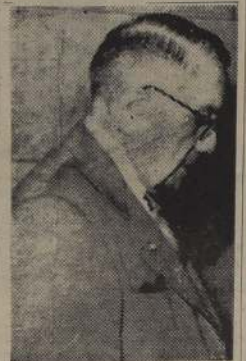
FEDERICO CHAVES. — Inició su segundo periodo presidencial en Paraguay.

EL NUEVO GABINETE A continuación, el doctor Chaves tomó el juramento constitucional a su gabinete, que en su mayoría está constituido por los que lo acompañaron en su gestión anterior. Su composición actual es la siguiente: ministro de Relaciones Exteriores, doctor José