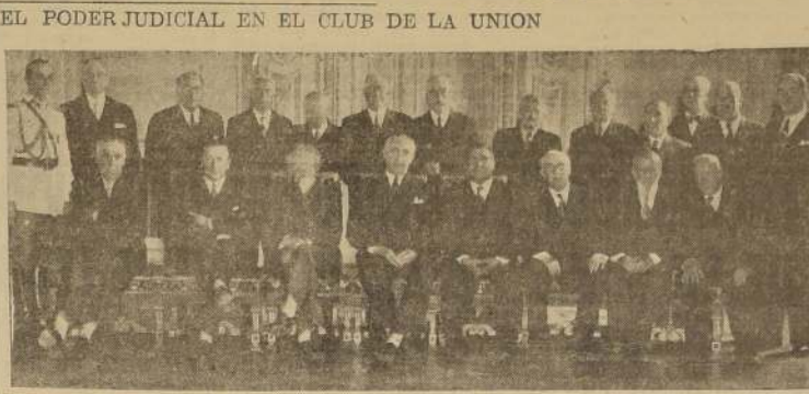
Asistentes al almuerzo ofrecido por la Corte Suprema a S. E. el Presidente de la República, en el Club de la Unión.