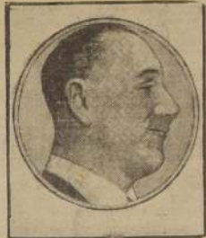
Colonel Tomás A. Ducó, que se alzó contra el Gobierno de Farrell y Perón

MOSCÚ, 16.—(U. P.)—(Por Harrison Salisbury).—Después de varios días de silencio, el alto comando soviético anunció esta noche la readmisión de la ofensiva de los ejércitos rusos en el sector septentrional de Estonia, donde fue cruzado el río Narva en un frente de 35 kilómetros, y se consiguió una penetración de 15 kilómetros al otro lado de las fronteras, doblando la resistencia del enemigo.