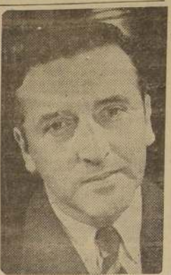
D. Oscar Gajardo, Ministro de Justicia