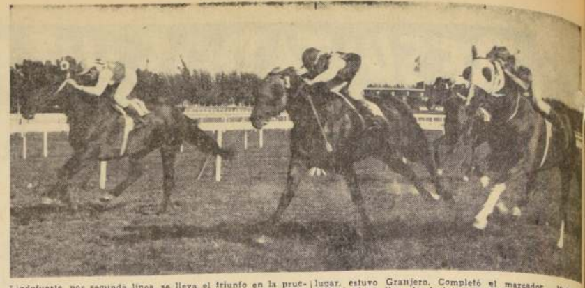
Lindofuerte, por segunda línea, se lleva el triunfo en la prueba central de la tarde. Por una cabeza derrotó a Deuixieme que lo tuvo dominado. También a una cabeza, en el tercer