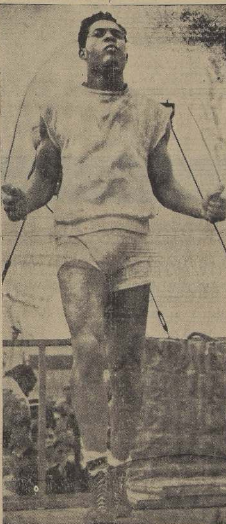
Louis ha practicado especialmente la cuerda para esquivar con agilidad la fuerte derecha que en el match anterior destruyó su resistencia.

Louis carece de defensa por su lado izquierdo y es por eso que Schmelling ha podido colocar con facilidad su derecha en pleno mentón del negro. Los partidarios del alemán creen que ese mismo defecto del negro le dará la victoria a Schmelling.