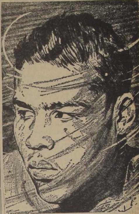
Joe Louis, norteamericano, actual campeón del mundo de peso pesado.

Se nos informa que las Emisoras: Otto Becker tienen la concesión para la transmisión en Chile, directamente desde el ringside, de las incidencias de este encuentro internacional. Con tal motivo, la afición de toda la República, podrá captar, en castellano, detalles amplios de la pelea sintonizando cualquiera de las dos ondas de estas Emisoras, CB 89 o CB 1170, onda corta y larga.