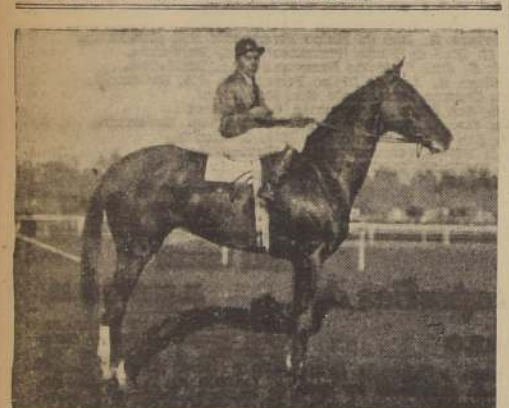
Grimsky defendió en el clásico "Guillermo Errázuriz U." en un compromiso no tan fácil como a primera vista parece

Los aprontes de ayer en las pistas del Club Hípico y en el Hipódromo Chile