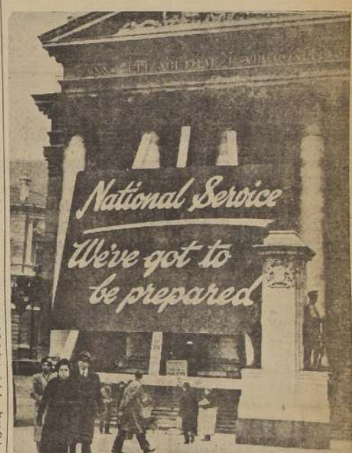
En todas partes de Inglaterra puede verse actualmente este letrero: "Servicio nacional.—Tenemos que estar preparados". En él se invita a los súbditos de Su Majestad a enrolarse en el Servicio nacional.