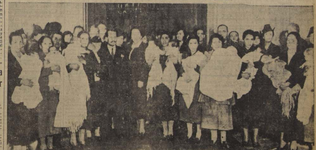
Durante la ceremonia efectuada ayer en la capilla del Palacio de la Moneda

La ceremonia fué presenciada por el Primer Mandatario y señora Juana Aguirre de Aguirre; por el Comandante en Jefe del Ejército y por el Director General de Investigaciones S. E. INVITO A LOS PRESENTES A UN BUFFET