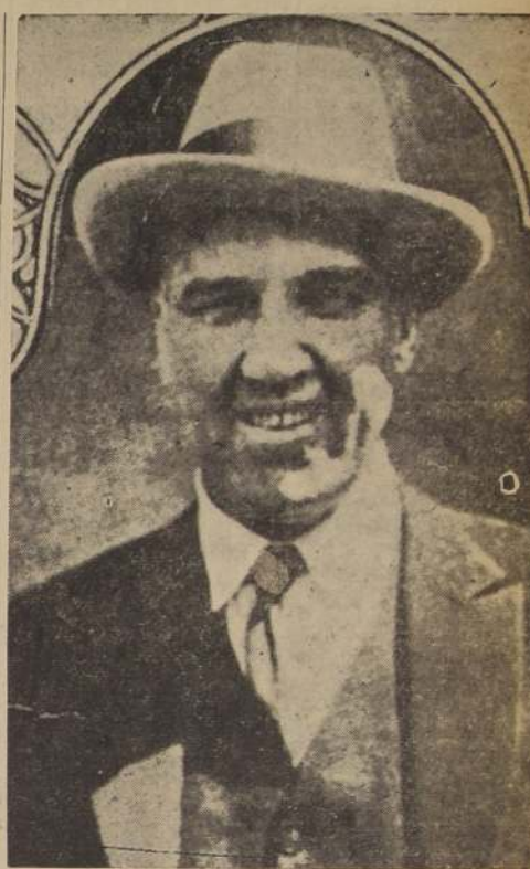
Jess Willard, el hombre que perdió su corona mundial frente a Dempsey

un blanco demasiado grande que vacilaba y se tambaleaba. Estaba completamente ciego de un ojo y apenas podía ver por el otro. No sabía de donde venían los golpes. Pero los absorbía uno por uno; aplababa golpe tras golpe, ya en la mandíbula, en el mentón, sobre el corazón, bajo el corazón en el hígado en el estómago, otras veces en la mandíbula, otra vez en el cuerpo; y en cada golpe iban 17 libras de peso.