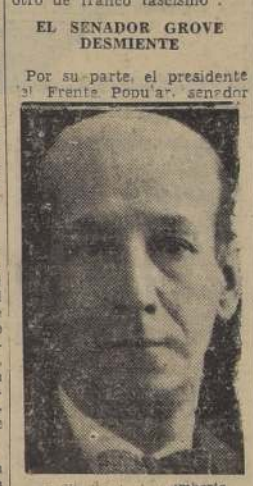
don Marmaduke Grove, hizo ayer el siguiente desmentido:

Por su parte, el presidente del Frente Popular, senador don Marmaduke Grove, hizo ayer el siguiente desmentido: