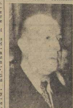
Senador don Marmaduke Grove

En los círculos políticos de Izquierda ha producido enorme indignación la información de "El Diario Ilustrado", especialmente en el seno del Partido Socialista.