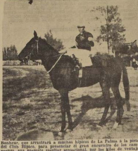
Bonheur, que arrastrará a muchos hípicas de La Palma a la pista del Club Hípico, para presenciar el gran encuentro de los campeones, que promete resultar sensacional, por los kilos de ventaja que recibe el hijo de El Maestro