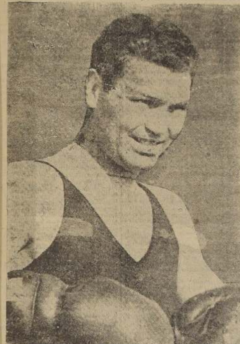
Jack Dempsey, el mejor boxeador de todos los tiempos

(VERSION EXCLUSIVA PARA "LA NACION", DE FRANK G. MENKE)