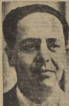
Don Pedro Alfonso, Ministro del Interior

EL DIPUTADO MARDONES DENUNCIA LA EXISTENCIA DE UNA ORGANIZACION FASCISTA-IBANISTA ENCARGADA DE PROPALAR RUMORES FALSOS Y ALARMANTES PARA PREPARAR EL CAMINO A UN GOLPE DE ESTADO