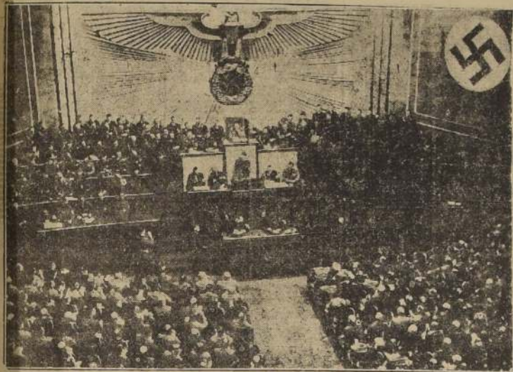
Aspecto que presentaba el Reichstag el viernes de la semana pasada, cuando el Canciller Hitler pronunció su discurso de respuesta al mensaje del Presidente Roosevelt.